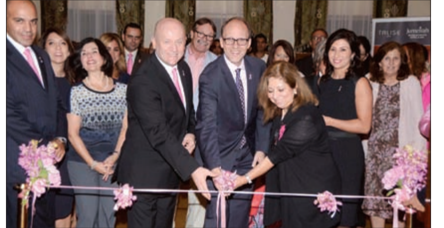
السفير الأميركي دوغلاس سيليمان، وهاكان بينيت يقصان الشريط

الحضور رؤاها القيمة حول المرض وأهمية الكشف المبكر وتجربتها في الخضوع للعلاج وحياتها اليوم بعد شفائها من المرض. وفي تصريح له بهذه المناسبة قال مدير عام الفندق هاكان بينيت: «باعتبارنا أعضاء في المجتمع الكويتي نحمل فندقي ومنتج جميرا شاطئ المسيلة قد دعم أيضا اليوم العالمي للتوعية بمرض التوحد واكتسى الفندق يومها باللون الأزرق. كما شارك الفندق في الاحتفال السنوي بيوم الأرض عبر اطفاء أو خفض مستوى الأضواء غير الضرورية لمدة ساعة كاملة.