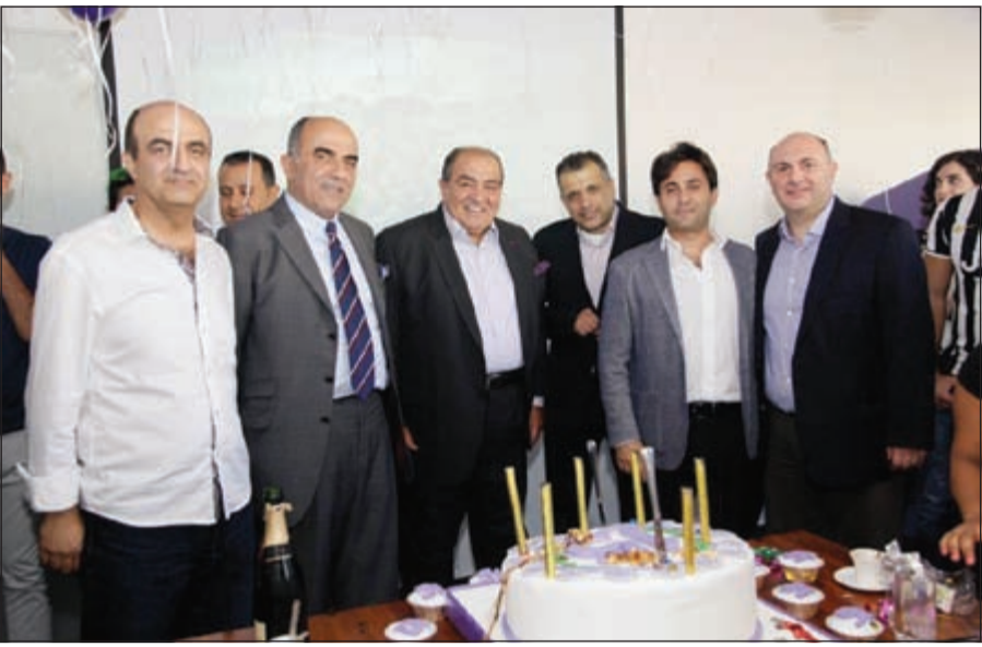
لقطة تذكارية بمناسبة الاحتفال بالذكرى الـ 15 لـ «مايندشير»

بدعم من وزارة الصحة، انطلقت مسيرة «حارب السكري» السنوية في 1 نوفمبر وذلك في شارع الخليج العربي. وقد شارك في المسيرة أكثر من 8000 شخص من جميع الأعمار لاجتياز مسافة 3.1 كم سيراً على الأقدام، وذلك بهدف زيادة الوعي حول مرض السكري الذي يصيب 25٪ من سكان الكويت. وتأتي مشاركة ماكدونالدز الكويت في هذا الحدث الرياضي كتأكيد منه على التزامه بدعم نمط حياة صحي وتشجيع كبار الشباب على حد سواء بعيش حياة نشيطة.