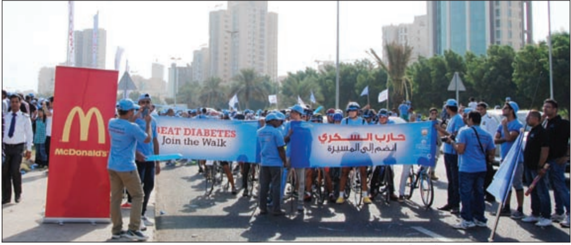
جانب من مسيرة «حارب السكري» السنوية

بدعم من وزارة الصحة، انطلقت مسيرة «حارب السكري» السنوية في 1 نوفمبر وذلك في شارع الخليج العربي. وقد شارك في المسيرة أكثر من 8000 شخص من جميع الأعمار لاجتياز مسافة 3.1 كم سيراً على الأقدام، وذلك بهدف زيادة الوعي حول مرض السكري الذي يصيب 25٪ من سكان الكويت. وتأتي مشاركة ماكدونالدز الكويت في هذا الحدث الرياضي كتأكيد منه على التزامه بدعم نمط حياة صحي وتشجيع كبار الشباب على حد سواء بعيش حياة نشيطة.