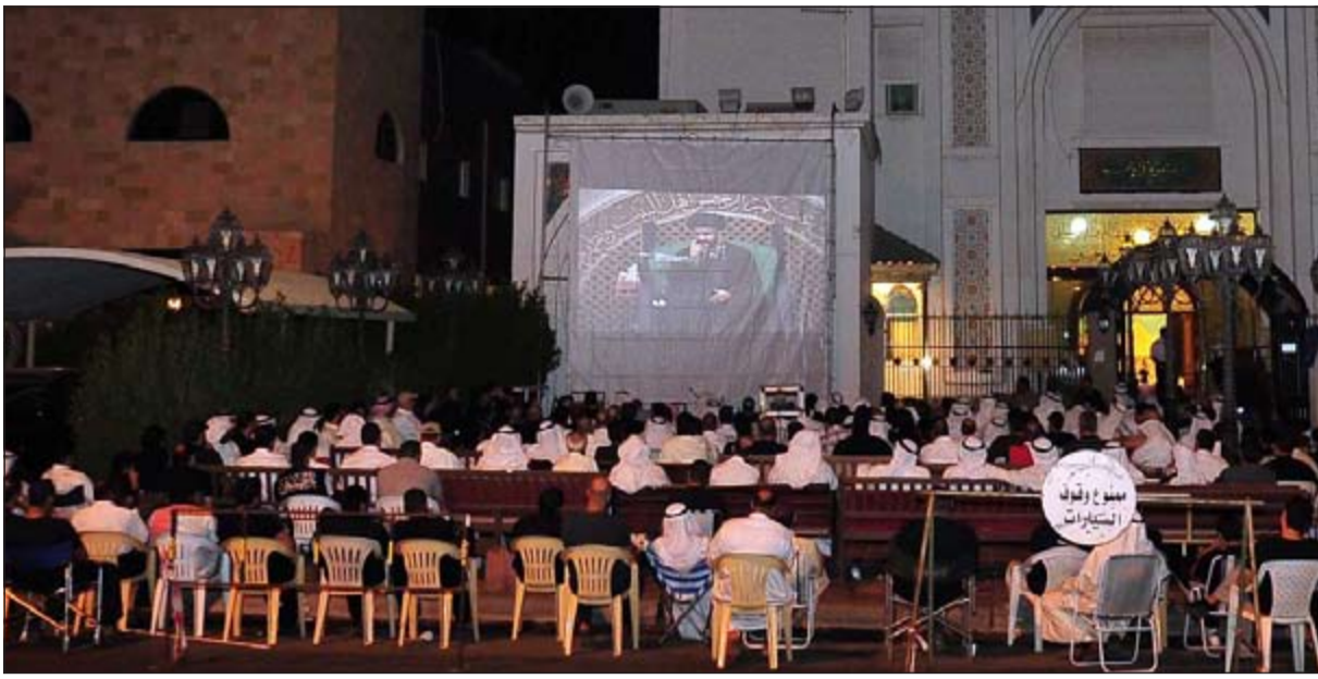
عدد من المعزين يتابعون المحاضرة في الساحة الخارجية لحسينية الأوجد