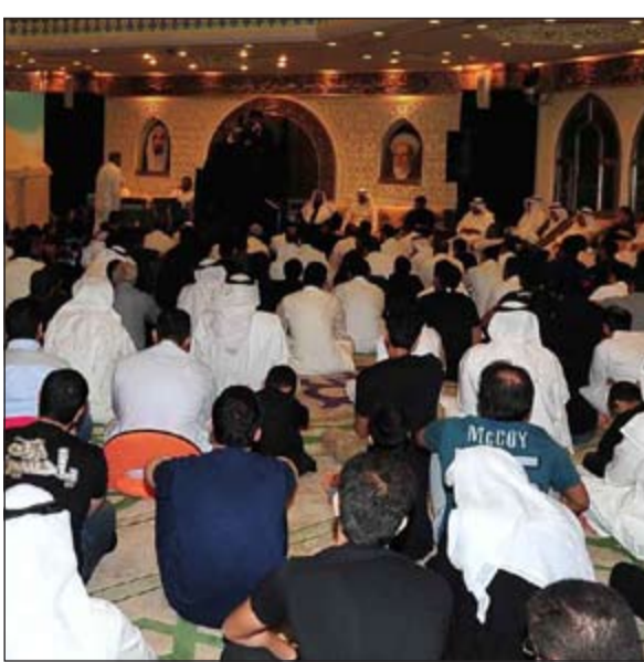
جمهور كبير من المعزين

فسلام على سيد الشهداء يوم ولد ويوم حارب الطغاة والارهابيين ويوم استشهد في سبيل اعلاء كلمة الحق واحياء دين جده المصطفى صلى الله عليه وآله.