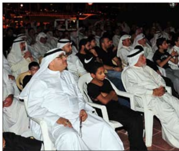
جانب من المعزين

يوجد مجال حينها للحياة إلا أنه انتصر. مبينا أن النصر ليس دائما على النحو العسكري بل هناك نصر يلوح بعد مدة من انقضاء المعركة قائلا: «ان هذه الانتصارات التي نشهدها في زمننا الحالي ووصلنا إليها طوال التاريخ جازاها ياخذون الحسين فصار أحيانا ياخذون منه بركة صبره وصاروا يميزون الحق والباطل والتفاني بالبدل في سبيل الله وترجم ذلك في مواجهة إسرائيل وحفظ المقدسات وأرواح المسلمين وغير المسلمين».