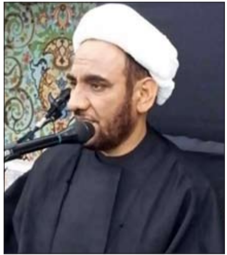
الشيخ عبد الأمير الخزاعي