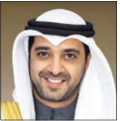
الشيخ محمد العبدالله