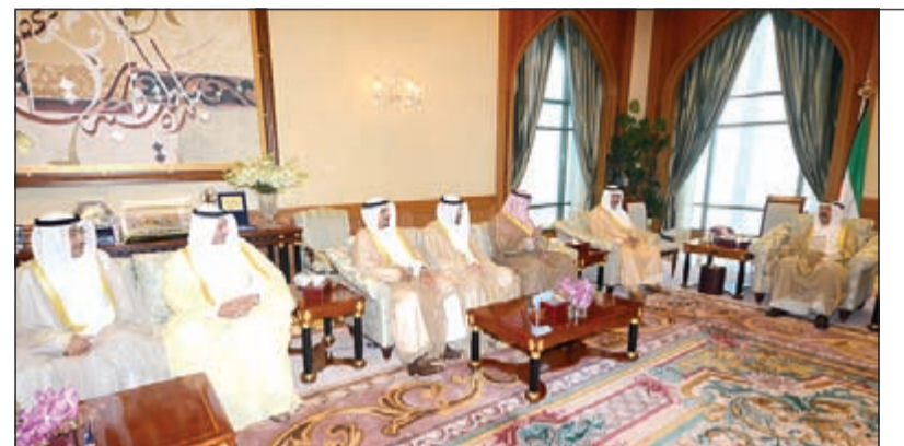
صاحب السمو الأمير الشيخ صباح الأحمد خلال لقائه سمو رئيس الوزراء الشيخ جابر المبارك وزير الخارجية الشيخ صباح خالد وعبد من رؤساء البعثات الدبلوماسية الجدد

صاحب السمو حثّ رؤساء البعثات الدبلوماسية الجدد على خدمة المصالح العليا لوطننا العزيز وتمثيل الكويت خير تمثيل في المحافل الإقليمية والدولية 12