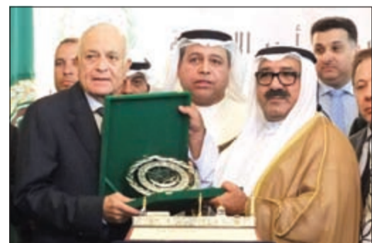
ممثل سمو الأمير وزير الدبلوماسية الأمير الشيخ ناصر صباح الأحمد يتسلم تكريم صاحب السمو من د. نبيل العربي

صاحب السمو حثّ رؤساء البعثات الدبلوماسية الجدد على خدمة المصالح العليا لوطننا العزيز وتمثيل الكويت خير تمثيل في المحافل الإقليمية والدولية 12