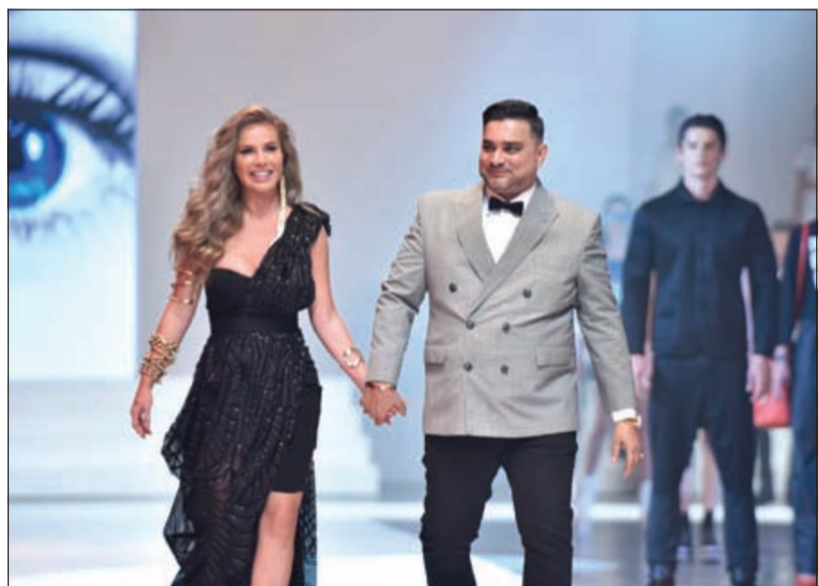
تيكول سبابا خلال العرض

الرائحة نيكول سبابا لتتضم إلينا في احتفالاتنا بجوهر شعار العلامة «في حب الموضة». وإلى جانب فكرة «21 Exit» التي تعكس الوصول إلى مرحلة النضج في سن الحادية والعشرين، قمنا بطرح «تشكيله الاستوديو» وهي مجموعة من التصاميم الحصرية التي تضم قطعاً بارزة مميزة ولكن بأسعار مناسبة. وتعكس هذه التشكيله التي عرضناها أحدث وأبرز صيحات الموضة لهذا الموسم بأسلوب «سبلاش» وستتوافر للبيع لدى جميع متاجر العلامة وعبر الإنترنت اعتباراً من 20 أكتوبر.