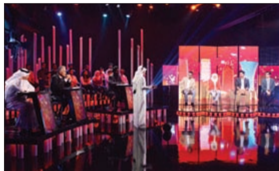
المشاركون بانتظار النتائج