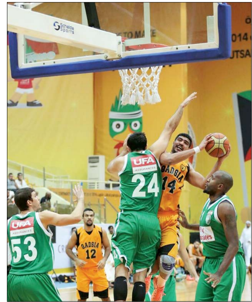
دفاع قوي من لاعبي الحكمة منع القادسية من بلوغ نصف النهائي

جهد فريق الحكمة اللبناني نظيره القادسية من لقب بطولته الدولية لكرة السلة، بعد فوزه عليه 82-69 في اللقاء الذي جمعها على صالة فحجان هلال المطيري ضمن منافسات الدور ربع النهائي للبطولة، وكذلك فقد تأملت أندية الاتحاد السكندري المصري والحكمة والتضامن اللبنانيين إضافة إلى بتروشيمي إلى الدور قبل النهائي، حيث جاء تأهل الاتحاد السكندري بعد فوزه على نظيره العربي 91 - 50 فيما تأهل التضامن اللبناني بعدما تجاوز النصر 113 - 61، بينما تأهل بتروشيمي الإيراني بعد تغلبه على الفتح السعودي 83 - 74 مكملا عقد الفرع الأربعة المتاهلة للدور النصف النهائي.