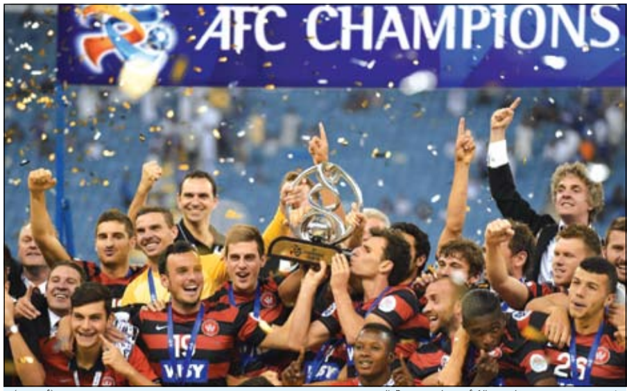
لاعبو سيدني يحتفلون بالكأس على منصة التتويج