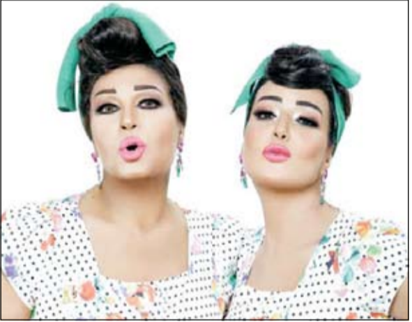
فيفي وسمية في أحدث إطالة لهما

من جانبها كشفت فيفي عبده، سر ظهورها مع سمية الخشاب، حيث نشرت واحدة من هدية الصور في حسابها على «إنستغرام»، وكتبت معلقة: «يا مساء الورد، بمشيئة الله انتظرونا رمضان 2015، بجبكم أوي