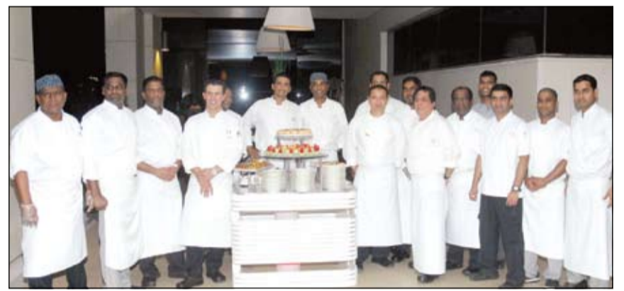
فريق الطهاة في فندق سيمفوني