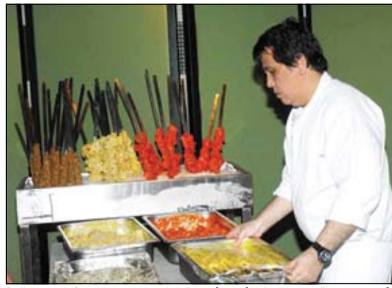
ماكولات شهية تحضر على ايدي امهر الطهاة (هاني عبدالله)

تتوفر ساعات Fendi My Way من الستيل، او من الستيل مع اطار من الذهب الاصفر او الوردي، كما تتوفر باصدارات مصنوعة كلياً من الذهب الاصفر