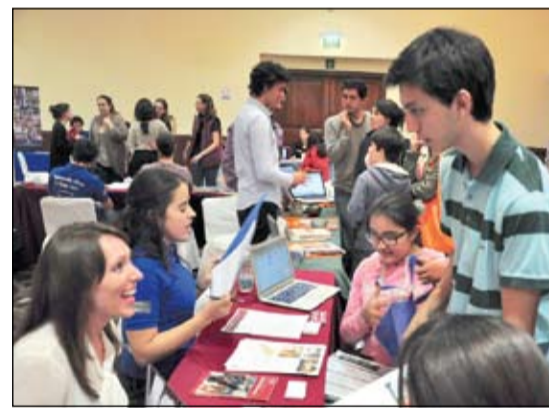
عدد كبير من المشاركين

إلى الأبد. يقوم بتعليم الطلاب نخبة من المعلمين ذوي المستوى الرفيع من المؤهلات والدافعية. يقترن ذلك مع الفصول الدراسية صغيرة العدد مما يشجع على التفاعل الهادف، وكذلك على إمكانية التعلم الذي يمتد ليشمل الأنشطة والرياضات والمشروعات الفنية خارج حدود الفصل الدراسي، وسوف تترك سريعا السبب الذي جعل خريجو هذه المدارس يتمتعون بالمهارات الدراسية العريضة، وكذلك المهبة مع التطور والتطوير إلى ما هو أبعد من أقرانهم. لقد حظي العديد من الملوك والملكات، ورؤساء الوزراء وكذلك كبار رجال الأعمال بميزة التعليم في المدارس الداخلية. تمتلك المدارس الداخلية تقاليد رصينة للفتوق الأكاديمي، وتعتمد على نماذج تعليمية من مختلف المناهج الدراسية. يمتد التعلم في المدارس الداخلية إلى ما هو أبعد من حدود الفصل الدراسي. نظرا لمعيشة الطلاب جنبا إلى جنب مع فريق العمل، فإن الطلاب يستفيدون من «فرص داخل وخارج الفصل الدراسي.