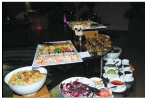
باقة من أشهر المقبلات

وقام الفريق الإداري بالفندق والترحب بالضيوف الذين استمتعوا بأجواء رائعة حول حوض السباحة، حيث قام فريق الطهاة بعرض مهاراتهم وإعطاء الضيوف