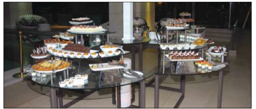
تشكيلة متنوعة من أطباق الحلويات