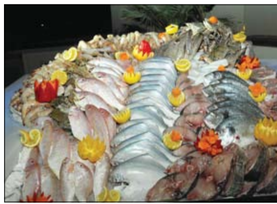
الاسماك الطازجة تعد مباشرة قبل التقديم للمائدة حسب اختيار الضيف