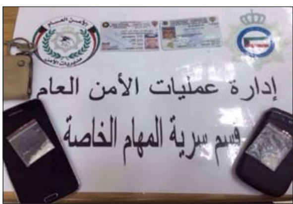
المضبوطات احيلت إلى «المكافحة»