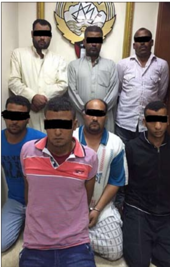
الموقوف للاشتباه ثبت تورط 4 منهم في الجريمة