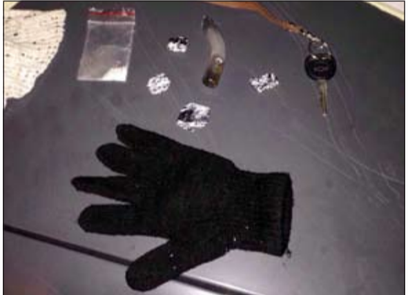
المضبوطات في كبد تنوعت بين شبو وحشيش وقفاز