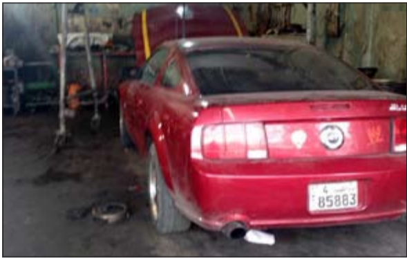
المركبة التي ابلغ عن سلبها بالاكراه ضبطت في كراج