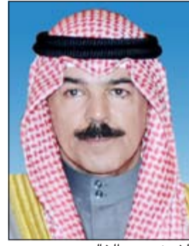
الشيخ محمد الخالد

عن إحباط محاولة ترويج نحو 4,5 ملايين قرص مخدر في إمارة دبي وإمارة أبو ظبي. وأكد بن زايد ان الجهد الذي قامت به وزارة الداخلية الكويتية يجسد روح التعاون ويبرز التنسيق الأمني بين البلدين الشقيقين في إطار دول مجلس التعاون لدول الخليج العربية. من جانبه، توجه نائب رئيس مجلس الوزراء ووزير الداخلية الشيخ محمد الخالد بالشكر والتهنئة لأخيه سمو نائب رئيس مجلس الوزراء ووزير الداخلية بدولة