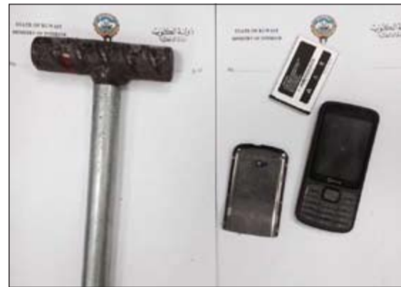
المطرقة التي استخدمت في الطريقة والهاواتف التي قادت لضبطهم

المتهمين ضابطوا في منطقتي الفروانية وخيطان وجاء ضبط الجناة بعد ان ارشدت احدى شركات الاتصالات عن استخدام متهمين لهااتفيهما خلال تخلصهما من الجثة في