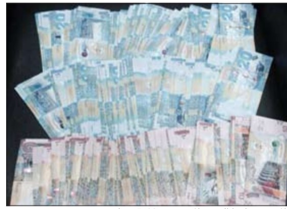
المتهمون باعوا الحديد المسروق بـ 5400 دينار