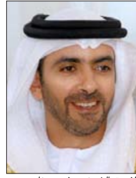
الفريق الشيخ سيف بن زايد

الإمارات العربية الشقيقة الفريق الشيخ سيف بن زايد آل نهيان على هذا الإنجاز البارز لوزارة داخلية دولة الإمارات العربية المتحدة الشقيقة والذي يتمثل في إحباط ترويج أكبر شحنة من الحبوب المخدرة في تاريخها. وشدد على ان وزارة الداخلية الكويتية تضع جميع إمكانياتها من أجل دعم المؤسسة الأمنية بدولة الإمارات العربية المتحدة الشقيقة وأن العلاقات الراسخة بين البلدين تضرب بجذورها في أعماق التاريخ، وأن الانتصار الذي حققه رجال الأمن في أبو ظبي وببي هو انتصار لرجال الأمن في الكويت فامتنا كل واحد لا يتجزأ. وكان الفريق سمو نائب رئيس مجلس الوزراء ووزير الداخلية بدولة الإمارات العربية الشقيقة الفريق الشيخ سيف بن زايد آل نهيان قد تابع بنفسه العملية واسمها الكودي «الأبواب الخشبية» وأشرف على توجيه فريق محترف من الإدارة العامة لمكافحة المخدرات ضم عناصر أمنية