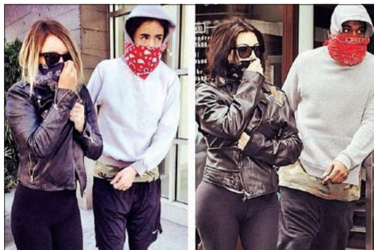
الفتاتان أثناء التقليد