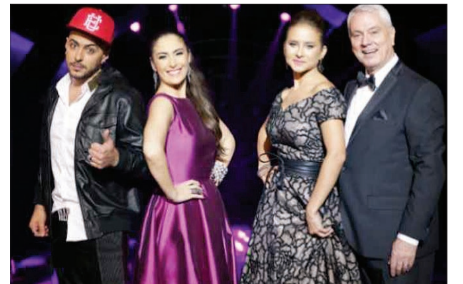
لجنة تحكيم «يلا نرقص»

وتعتمد فكرة البرنامج على اكتشاف المواهب في الرقص الحديث والكلاسيك، وهو النسخة العربية للبرنامج العالمي الشهير الذي يحمل العنوان نفسه، وقدم منه حتى الآن 10 مواسم في أميركا، والبرنامج لا يركز على نوع واحد من الرقص مثل بعض البرامج الأخرى، ولكن هذا البرنامج سيتخرج من خلاله راقصون محترفون في العديد من أنواع الرقص، لأن الفائز يشترط عليه أن يجيد كل أنواع الرقص، واستعان البرنامج بمدرسين محترفين في كل فنون الرقص لتدريب المتسابقين خلال فترة التصوير.