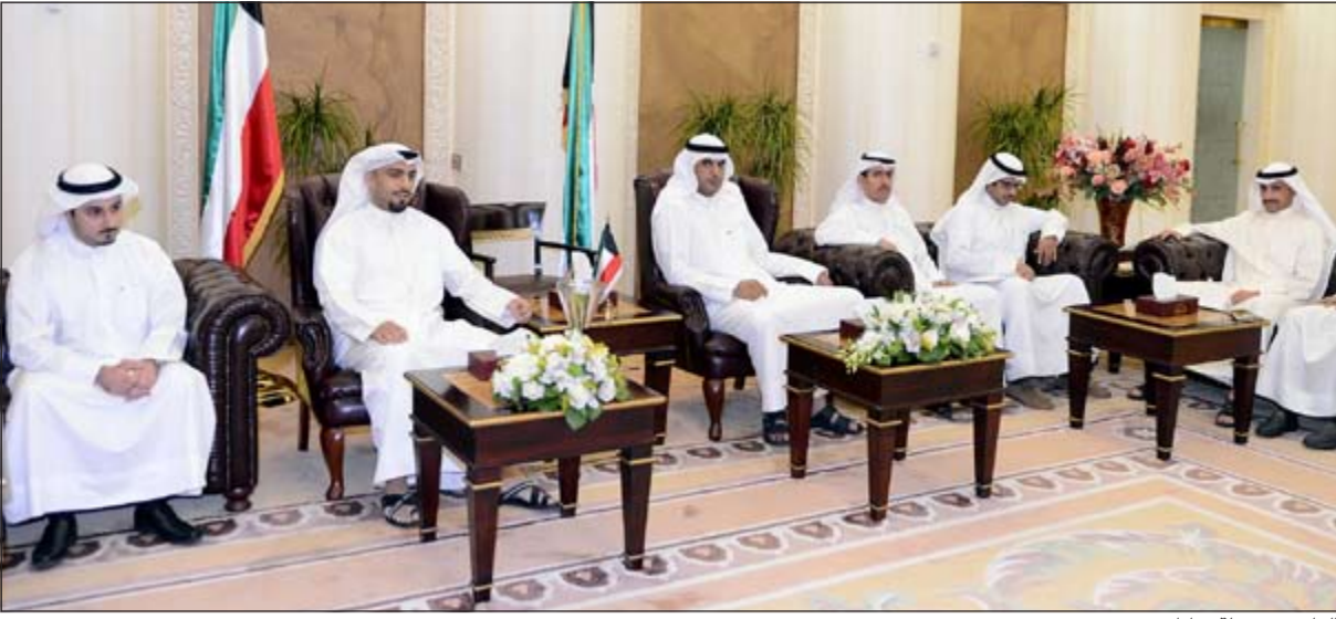
الغانم مع حملة «ناظر بيت»