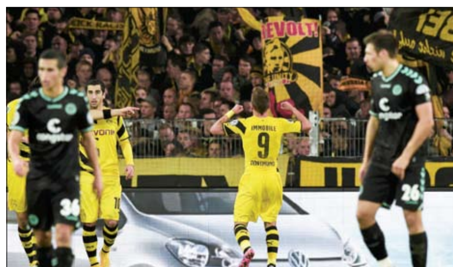
سعادة ايبوبيلي بهدفه