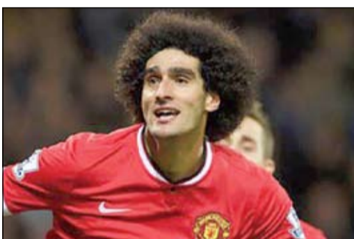
الجماهير تريد المزيد من البلجيكي فيلاني

دخل البلجيكي مروان فيلاني لاعب مان يونانيدت ضمن قائمة أفضل لاعب بصوف الشياطين الحمر بشهر أكتوبر.