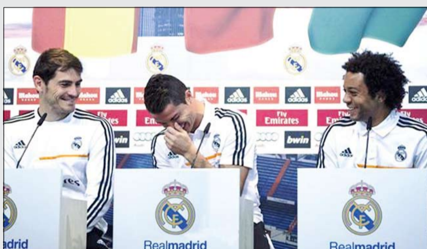
ماذا فعلت لهم يا كارلو؟

مختلفة، فبعد أن رقص الاثنان في الملعب معا، وأظها في موسم 2011-2012 علاقة صداقة قوية فيما بينهما، انهار هذا الأمر في الموسم التالي واستمر الحال في موسم أنشيلوتي الأول، وأعدت الصحافة المديرية آنذاك الأمر إلى غضب رونالدو من تصريحات للبرازيلي قال فيها إن ليونيل ميسي هو من يستحق الكرة الذهبية عن عام 2012، واستمرت العلاقة المتوترة وظهرت في التجمعات بين اللاعبين وفي الاحتفالات، لكن صورة نشرها مارسيلو مؤخرا أكدت بأن الأمور عادت لحالتها، فكلاهما يسافران بجانب بعضهما البعض، وبعيدا عن تلك الصورة وقرب رونالدو أيضاً كان يجلس إيكركاسياس.