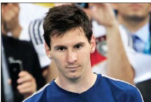
ميسي المتوج بجائزة أفضل لاعب مونديال

ردت صحيفة «سبورت» الكاتلونية على تصريحات جوسيب بلاتر والتي قال فيها إن ليونيل ميسي لم يستحق جائزة أفضل لاعب في كأس العالم. وقالت الصحيفة في التقرير إن استعراض قائمة الفائزين في السنوات الأخيرة منذ مطلع تسعينيات القرن الماضي يوضح أن المسألة كانت للترضية، فباستثناء عام 1994 الذي فاز بجائزتها روماريو، لم يحصل على هذه الجائزة نجم الفريق الفائز بكأس العالم، وأنها كانت بمنزلة الترضية لأحد النجوم الكبار في البطولة الذين قادوا فريقهم لدور بعدد.