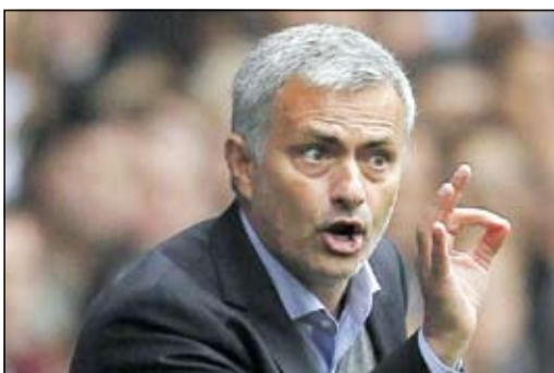
أخذوا غضب الداهية

تحدث جوزيه مورينيو مدرب تشلسي عن أداء المصري محمد صلاح والألماني أندري شـورله أثناء فوز فريقه على شروسبيري بهدفين لهدف في كأس المحترفين.