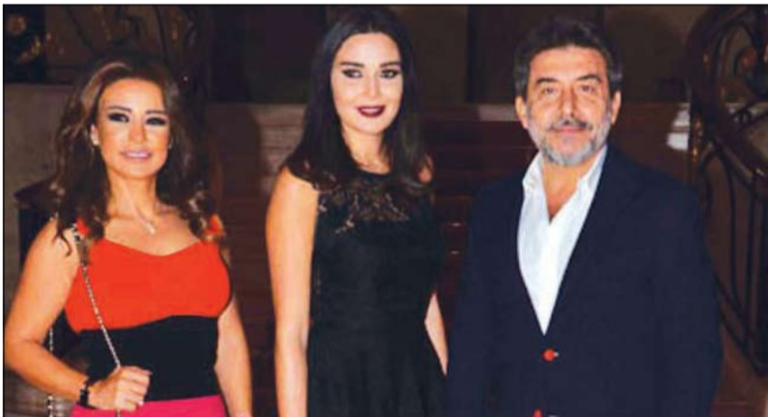
.. ومع عابد فهد

المخرج سعيد الماروق. من جهتها، اعتبرت ماغي بوغصن أنها تعود من خلال «24 قيراط» إلى الدراما في العالم العربي مؤكدة خشبيتها من الوقوف أمام كاميرا سعيد الماروق وإمام عابيد فهد وسيرين عبد النور ونص ريم حنا لأنها «مسؤولة كبيرة جداً» وقالت: أتمنى أن أكون على قدر هذه الخطوة. ووصفت دورها بـ «السهل-الصعب»، وقالت: أجسد دور امرأة تعيش برفاهية في قصر مع زوجي وعائلتي. ويتعرض زوجي لإطلاق نار ويختفي ويقعد ذاكرته ويبحث عنه وتتوالى الأحداث لأتخلى عن كل شيء وأطل كامرأة عصامية قوية تسعى للحفاظ على عائلتها.