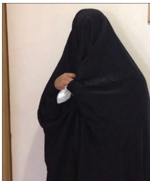
الواقعة بعد ضبطها في متطقة سعد العبدالله