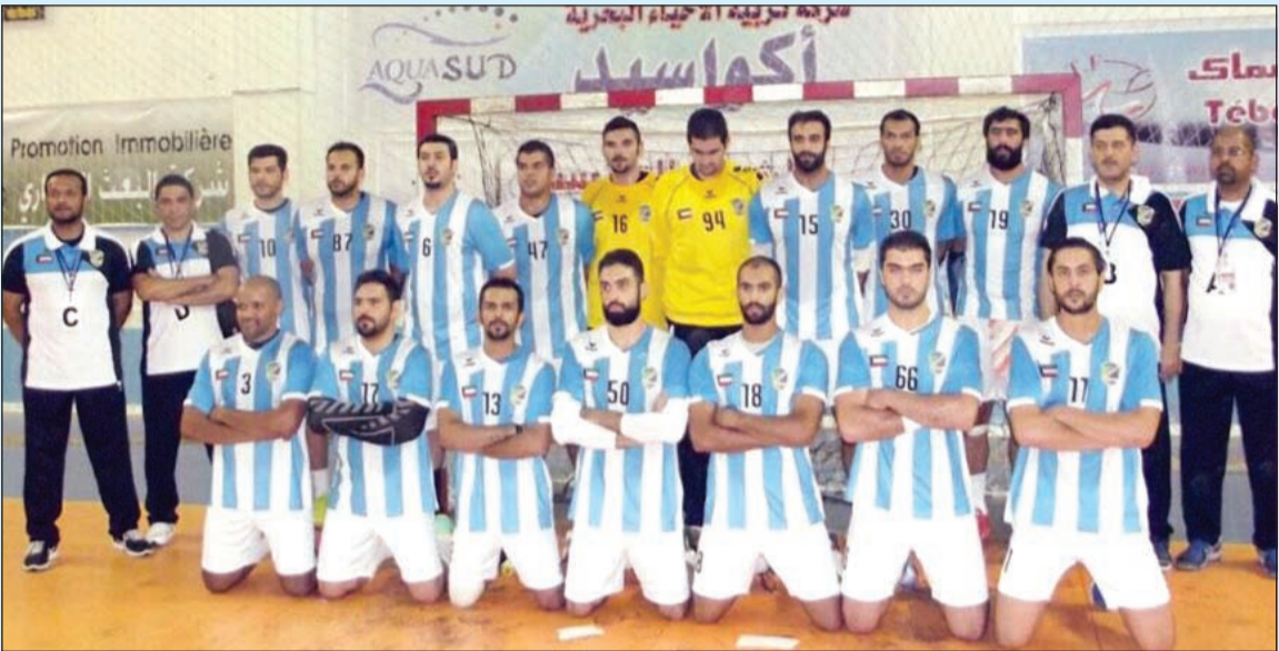
فريق اليد بالسالمية تعرض الى اللطم

ورغم الخسارة قدم السماوي عرضا مشرفا أمام الفريق المنظم للبطولة وجماهيره، وكان ندا للفريق التونسي طوال شوطي المباراة وتسببت الأخطاء الفردية وضعف التركيز في فقدان الكرة في عدد من الأوقات الحرجة، استثمرها بالهجوم العكسي الفريق التونسي ليترجمها إلى أهداف في مرمى الفريق.