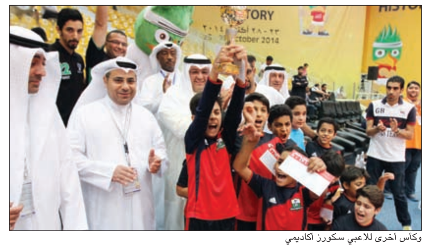
وكأس أخرى للاعبين سكورز أكاديمي

برعاية الشيخ طلال الحمد نجح فريق أكاديمية إيفرتون في حسم لقب بطولة الأكاديميات والتي أقيمت على هامش اليوم الختامي لبطولة القارات لكرة قدم الصالات وذلك على حساب اتوم مواليد 2002/2001 وانتهت مباراة الفريقين بفوز إيفرتون بهدفين مقابل لا شيء في مباراة جاءت قوية ومثيرة من كلا الطرفين حاول خلالها كل فريق ان يفرض سيطرته على اللقاء ووضع امتلاك