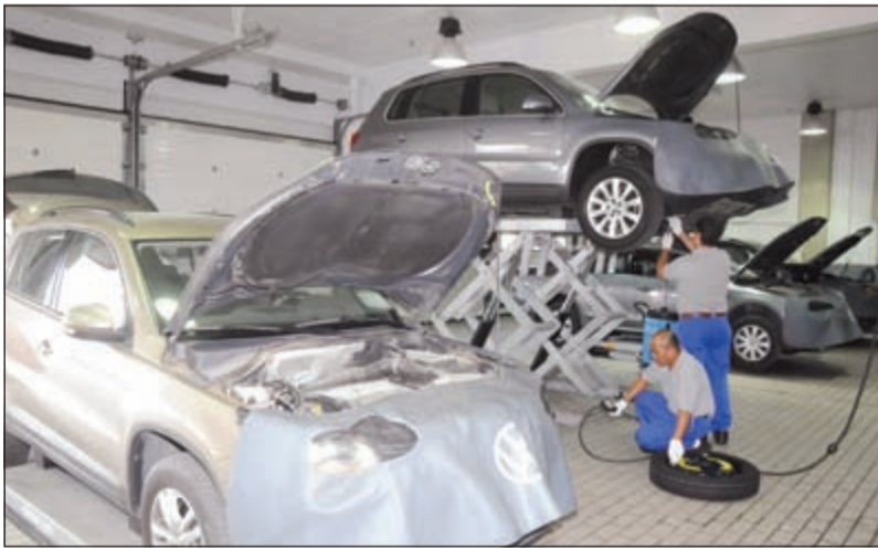
صيانة سيارة لأحد العملاء