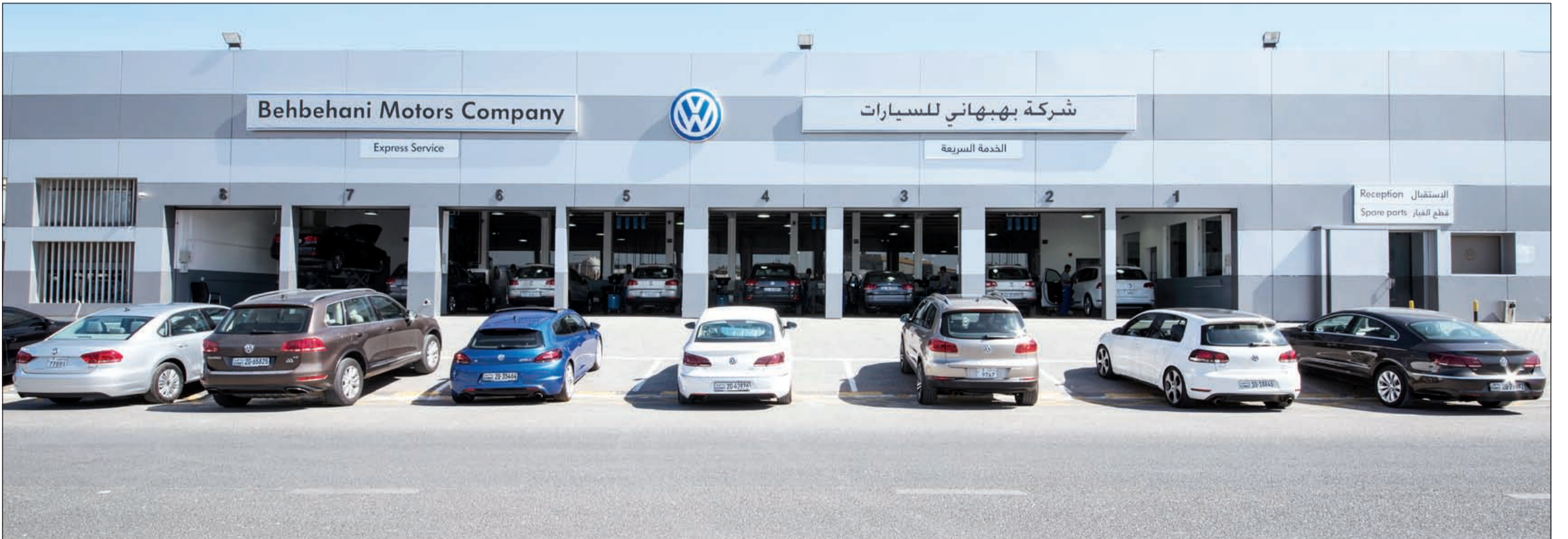
مركز الخدمة السريعة لـ «فولكس واجن» في الشويخ من الخارج