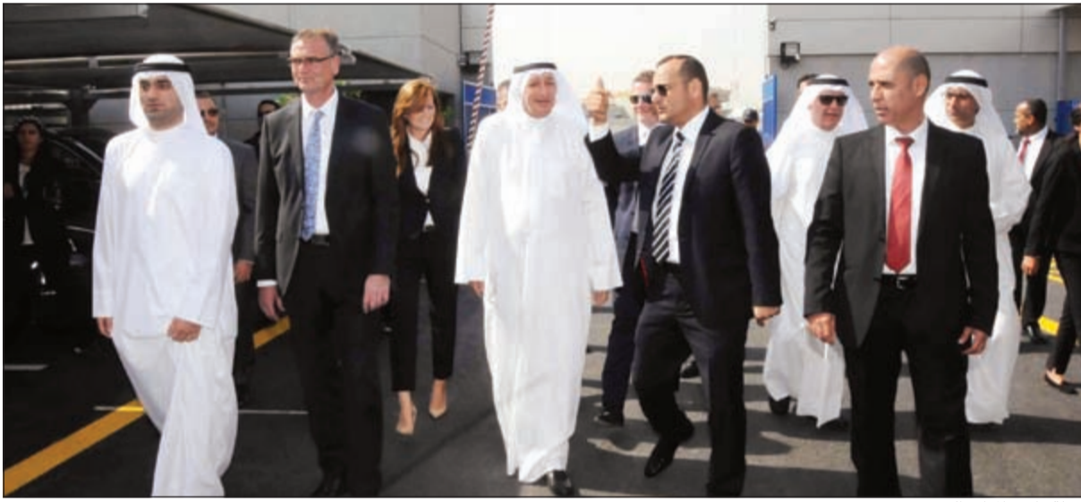
جولة داخل المركز الجديد