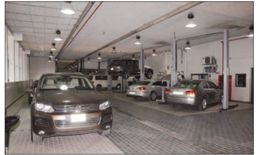
المركز يتسع لاستقبال العديد من السيارات