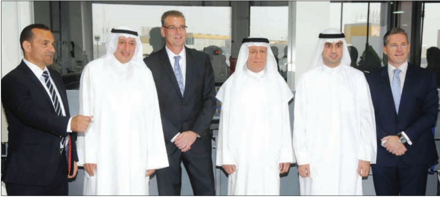
..وفي لحظة تذكارية

عبد الرحمن خالد أعلنت شركة بهبهاني للسيارات، الوكيل الحصري لفولكس واجن في الكويت عن افتتاح مركز الخدمة السريعة في الشويخ. ويقع مركز الخدمة الجديد في منطقة السيارات في قلب مدينة الكويت، ويمتد على مساحة 450 متراً مربعاً، مقدماً خدمة منقطعة للنظير، بمفاتيح خانات جديدة للخدمة، وأحدث معدات التشخيص، وفرق عمل تتكون من خبراء وفنيين مدربين على مستوى عالمي. بموقعه القريب من طريق المطار، سيقدم مركز الخدمة السريعة خدمات بسيطة وبعض التوصيلات، وذلك دون الحاجة لحجز موعد مسبق أو الانتظار لوقت طويل في المركز المنتظر، والذي يتميز أيضاً بتواجد محل لقطع الغيار والإكسسوارات الأصلية. وتعليقاً على افتتاح مركز الخدمة السريعة، قال المدير العام لشركة فولكس واجن في الكويت عبدالله علي: «يعد تقديم خدمة من الطراز العالمي لعملائنا من أهم أولوياتنا. سياراتنا مصممة وفقاً لأفضل معايير الهندسة الألمانية عالية الجودة، ما يعني فترات خدمة صغيرة من 15,000 كم (أو سنة واحدة). وبوجود مركز الخدمة السريعة الجديد، بإمكان عملائنا قضاء وقت أقل على المهام العادية، وصيانة السيارة، ووقت أكثر في طرقات الكويت». ينضم مركز الخدمة السريعة إلى باقة فريدة من مراكز فولكس واجن كاملة التجهيز، والتي تتضمن معرضاً جديداً مميّزاً في الري ومركز خدمة رئيسياً في الشويخ.