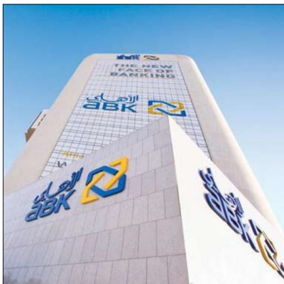
المقر الرئيسي للبنك الأهلي الكويتي

وكان البنك قد أعلن أمس عن بياناته المالية المرحلية للأشهر التسعة الأولى من 2014 محققاً أرباحاً قدرها 27,3 مليون دينار تقريبا مقابل أرباح بنحو 25,2 مليون دينار عن نفس الفترة من العام الماضي، بارتفاع في الأرباح تقدر نسبتها بنحو 8,3٪، وجاء نمو الأرباح نتيجة زيادة حجم الأعمال وإجراءات خفض التكاليف. وحول توجهه العديد من البنوك الكويتية إلى إجراء تسويات مع الشركات العقارية والاستثمارية، وما إن كان للبنك الأهلي حصة في ذلك الأمر قال: إن الأهلي