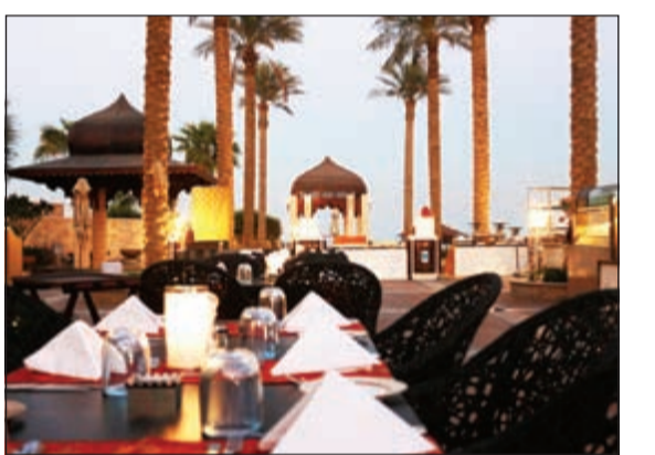
جميرا شاطئ المسيلة

أعلن فندق ومنتجج جميرا شاطئ المسيلة، الوجهة الفندقية الأكثر فخامة في الكويت، عن البدء في استضافة أمسيات الباركيو «تشيل اند غريل» للاستمتاع بالأجواء والطقس المعتدل في الكويت هذه الأيام، وذلك ابتداء من الأربعاء 22 أكتوبر، ومساء كل أربعاء سيتمتع الضيوف بأمسيات الشواء مع اطلالة ساحرة على المسبح والخليج العربي. ويوفر فندق ومنتجج