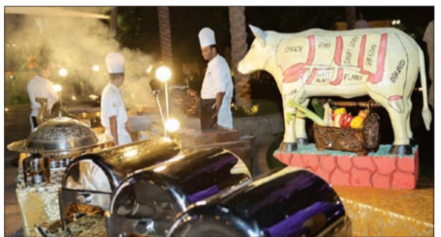
الشواء في الهواء الطلق