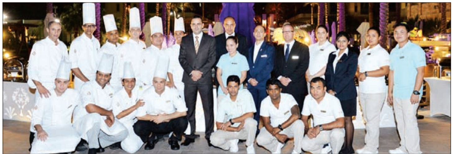
لقطة تذكارية لفريق فندق ومنتجج جميرا شاطئ المسيلة

التي جانب تجربة مشروبات الكوكتيل المتنوعة. وبعد تناول العشاء، سيستنى للضيوف الاستلقاء على مقاعد الاسترخاء المريحة المنتشرة على الشاطئ والاستمتاع بالاطلالة على مياه الخليج العربي، وذلك على نغمات العزف الموسيقي الحي على العود، مع تقديم الشيشة وأصناف الشاي والقهوة لختام أمسية استثنائية في أجواء مثالية رائعة.