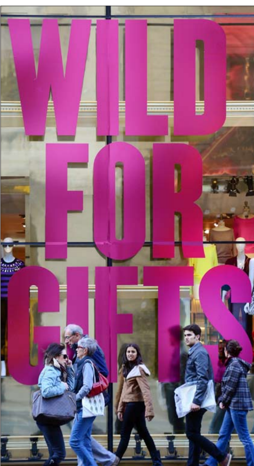
من الكويت الى اميركا.. تبدو أسعار السلع والخدمات بالعالم في طريقها للارتفاع بوتيرة أسرع من المتوقع رغم انخفاض أسعار النفط التي كان من المفترض أن تخفف تكاليف الإنتاج وتؤثر على الأسعار..في الصورة بافظة اعلانية في نيويورك تحث على الاستهلاك عبر تقديم الهدايا مع قرب موسم الأعياد

في وقت سجلت المجموعة الرئيسية الخامسة (الصحة) ارتفاعاً بنسبة 0,16٪. وبينت إدارة الإحصاء ان المجموعة الرئيسية السادسة (النقل) ارتفع فيها التضخم في شهر سبتمبر الماضي بنسبة 2,13٪ على أساس سنوي في حين انخفض الرقم القياسي للمجموعة الرئيسية السابعة (الاتصالات) بنسبة 0,97٪ على أساس سنوي. وقالت ان التضخم في المجموعة الرئيسية الثامنة (الترفيه والثقافة) ارتفع في سبتمبر الماضي بنسبة 1,17٪ على أساس سنوي وارتفع هذا الرقم على أساس شهري بنسبة 0,20٪ كما ارتفع معدل التضخم للمجموعة الرئيسية التاسعة (التعليم) على أساس سنوي بنسبة 6,45٪ وارتفع التضخم (المطاعم والفنادق) بنسبة 3,47٪ على أساس سنوي. وأشارت الإدارة المركزية للإحصاء في نشرتها ان التضخم في المجموعة الرئيسية الحادية عشرة (السلع والخدمات المتنوعة) ارتفع على أساس شهري بنسبة 0,16٪.