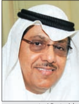
مبارك بنه الخرينج

بعث رئيس مجلس الأمة مرزوق الغانم ببرقيتي تهنئة الى كل من رئيسة المجلس الوطني في جمهورية النمسا دوريس بورييس ورئيسة المجلس الاتحادي آنا بلاتنيك وذلك بمناسبة العيد الوطني لبلدهما. كما بعث الرئيس الغانم ببرقيتي تهنئة الى كل من رئيس البرلمان (البوندستاج) في جمهورية ألمانيا الاتحادية