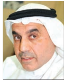
عبدالله محمد الطريجي

في رد على سؤال النائب عبدالله محمد الطريجي بشأن آلية اختيار عميد المعهد ومساعدته ورؤساء الأقسام بالمعهد العالي للفنون المسرحية، قال نائب رئيس مجلس الوزراء وزير التجارة والصناعة وزير التربية والتعليم العالي بالوكالة: يسعدنا أن نرقد لكم الرد على السؤال المذكور كالتالي: