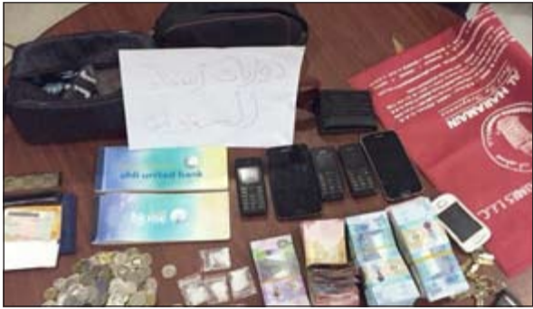
المخدرات والـ 8 الاف دينار أحيلت للاختصاص