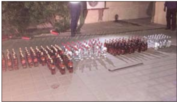
الخمور المضبوطة جميعا مستوردة

أحال مدير عام الإدارة العامة لدوريات النجدة اللواء زهير النصرالله إلى الإدارة العامة لمكافحة المخدرات مواطنا لحيازة مواد مسكرة بقصد الاتجار، وأرقي في ملف الإحالة 193 زجاجة خمر مستوردة، وقال مصدر أمني إن المواطن وجهت إليه تهمة إتلاف مال الدولة بعدما تعمد الاصطدام بدوريتين قامتسا بمطاردته، وبحسب مصدر أمني فإن إحدى دوريات النجدة اشتبهت في مركبة تسير ببطء شديد، حيث طلبت من قائد المركبة التوقف، إلا أنه رفض وحاول الفرار، ليقوم رجال النجدة بالتضييق