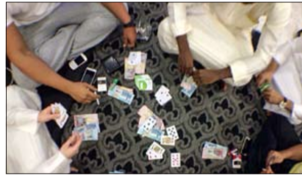
صالة القمار تبدأ عملها في الرابعة فجراً