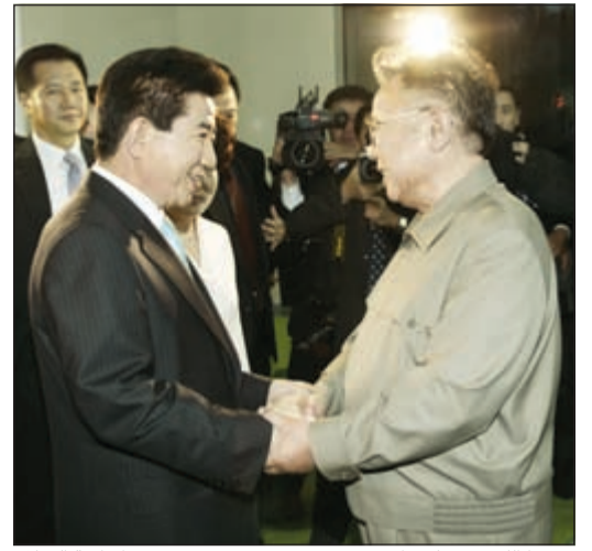
رئيسا الكوريتين كيم ايل سونغ ورومو هيون بعد توقيع اتفاقية السلام

قال عضو جمعية الصداقة الكويتية - الكورية ابراهيم القبدي ان شهر اكتوبر الجاري يصادف الذكرى الـ 34 لطرح مشروع تشكيل جمهورية كوريا الديمقراطية الكونفيدرالية من قبل رئيس كوريا الديمقراطية الراحل كيم ايل سونغ وذلك بهدف تحقيق الوحدة الكورية بطريقة سلمية ومستقلة.