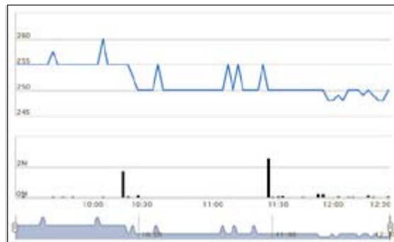
حركة تداولات سهم وربة خلال تداولات أمس

«الأنباء» على معلومات تفيد بتحركات تكتيكية إستراتيجية على السهم من قبل محافظ تابعة لعملاء وأخرى تتبع بنكا تقليديا من منطلق الحصول على حصة إستراتيجية في ملكية البنك تقارب الـ 5%. وكان رئيس مجلس إدارة البنك عماد الناقب قد أرجع في بيان البنك الأخير ارتفاع أرباح البنك بالربع الثالث من العام الحالي إلى ارتفاع النشاط التشغيلي حيث ارتفعت الإيرادات التشغيلية إلى نحو 13,2 مليون دينار بنمو بلغ 71,6%، وبلغت أرباح البنك الصافية 318 ألف دينار بارتفاع 110% مقارنة بالعام الماضي.