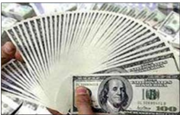
أميركا وأوروبا تستقطبان أصحاب الملايين في العالم

يعج عالم اليوم بنمو كبير لأصحاب الملايين، حيث أظهر أحدث تقرير يرصد حركة الثروات في العالم أن غالبية الساحة للمليونيرات في العالم تتركز في الولايات المتحدة وأوروبا، بينما يغرق العالم العربي في الفقر مع عدد قليل جدا من أصحاب الثروات المليونية، فيما يوجد في العالم أكثر من 35 مليون شخص يمتلكون أكثر من مليون دولار. وتبين من تقرير اقتصادي متخصص طرقت عليه «العربية.نت» أنه يوجد في العالم حاليا أكثر من 35 مليون مليونير، ويتوقع أن يرتفع عددهم خلال السنوات الخمس المقبلة إلى 53 مليون مليونير، بارتفاع قدره 53%. على أن النمو الأكبر في أعداد المليونيرات سيتمركز خلال السنوات الخمس المقبلة في الصين، وهو ما سيؤدي إلى تغير جوهر في خارطة الثروات في العالم. وصدر التقرير عن «كريدي سويس» وهي واحدة من أكبر الشركات في العالم المتخصصة بإدارة الثروات وتقديم الاستشارات الاستثمارية والخدمات المالية في العالم، على أن التقرير يعرف المليونير بأنه كل شخص يمتلك مليون دولار أو أكثر.