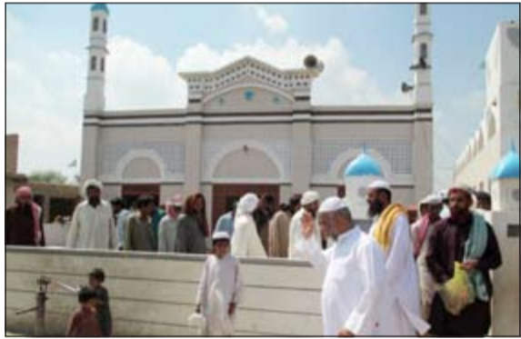
أحد مساجد اللجنة