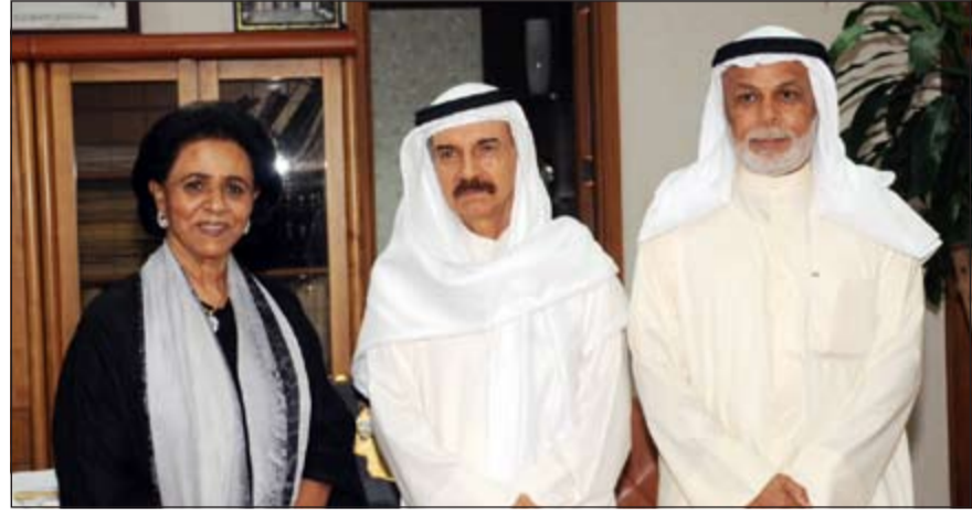
المستشار فيصل المرشد متوسلاً الشيخة فريحة الأحمد والمستشار يوسف المطاوعة

التقى رئيس المجلس الأعلى للقضاء رئيس محكمة التمييز والمحكمة الدستورية المستشار فيصل المرشد بمكتبه بقصر العدل الشيخة فريحة الأحمد رئيسة الجمعية الكويتية للأسرة المثالية والوفد المرافق المتميز المستشار يوسف المطاوعة حيث تمت مناقشة زيادة ظاهرة العنف بالبلاد ومحكمة الأسرة وازدياد نسبة الطلاق ونشر الوعي القانوني بين أفراد المجتمع وضرورة الالتزام الكامل بالمحافظة على هبة القضاء واستقلاله. وأوضح المرشد أهمية قانون محكمة الأسرة المعروف حالياً على مجلس الأسرة لما له من أثر فعال في حل كل القضايا الأسرية على وجه السرعة والفصل فيها بمعرفة محكمة متخصصة