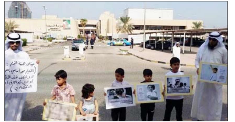
عدد من الطلبة البدون وأولياء أمورهم خلال الوقفة الاحتجاجية أمام مبنى «التربية»

لكنهم طبقوه في البداية على أطفال الصف الأول، وقد بلغ عدد من الطلبة في المراحل الأخرى بضرورة احضار شهادات الميلاد أو الطرد من المقاعد الدراسية. وذكر أن المادة طغت على مشاعر الناس فيلأماس كانت الاعتصامات تقام من أجل الكوارث والرواتب واليوم لا نجد من ينصر هذه القضية المستحقة، هل لأن الأطفال لا يستحقون المناصر؟! بدوره، أكد النائب السابق في المجلس المحلل د. خالد شخيران الكويت تخضع الاموال لحو الأمية، في حين تأتي الآن لتمنع أطفالاً في عمر الزهور من ممارسة حقه في التعليم، مشدداً على ضرورة أن يكون هناك تحرك سريع لوقف هذه القرارات.