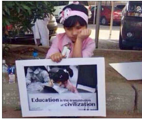
طفلة تطلب بحقها في التعليم