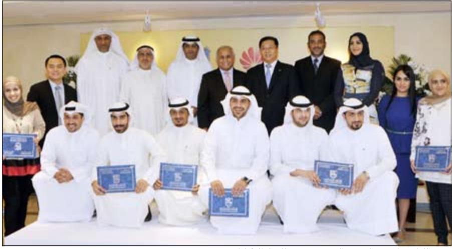
د.عبداللطيف البدر والسفير الصيني يتوسطن الطلبة المكرمين

من جانبه أشاد السفير الصيني تسوي جيان تشون بالتجربة التي خاضها الطلبة والتي تعد انعكاساً للعلاقات المتميزة التي تربط البلدين، لافتاً إلى أن التدريب الميداني الذي شارك به الطلبة يأتي ضمن التعاون متعدد المجالات مع الكويت خاصة مع الاتفاقيات المختلفة بين البلدين متمنياً أن يتسع هذا التعاون لما فيه من مصلحة مشتركة بين الصين والكويت.