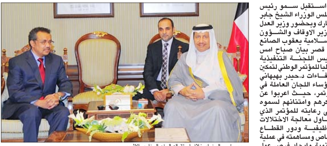
سمو رئيس الوزراء خلال استقباله الوفد الوزاري الإثيوبي

استقبل سمو ولي العهد الشيخ نواف الاحمد بقصر بيان صباح امس رئيس مجلس الأمة مرزوق الغانم. واستقبل سمو ولي العهد سمو الشيخ جابر المبارك رئيس مجلس الوزراء. واستقبل سموه بقصر بيان صباح امس النائب الاول لرئيس مجلس الوزراء وزير الخارجية الشيخ صباح الخالد. واستقبل سمو ولي العهد بقصر بيان صباح امس نائب رئيس مجلس الوزراء وزير الداخلية الشيخ محمد الخالد. كما استقبل سمو ولي العهد نائب رئيس مجلس الوزراء وزير الدفاع الشيخ