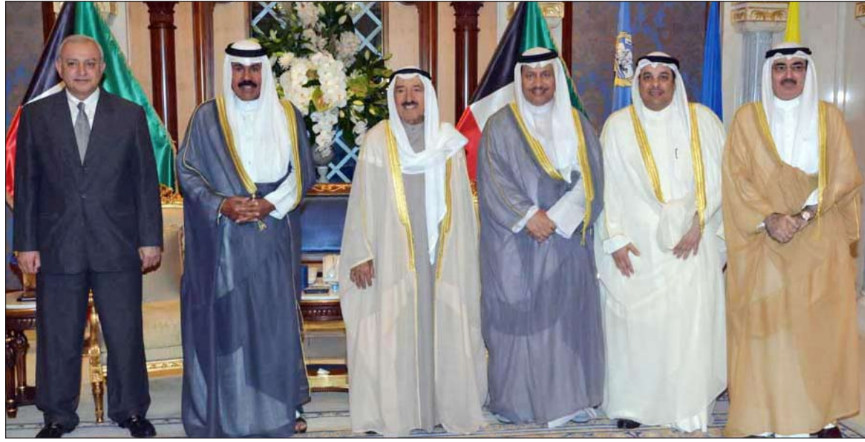
صاحب السمو الامير الشيخ صباح الاحمد وسمو ولي العهد الشيخ نواف الاحمد وسمو رئيس الوزراء الشيخ جابر المبارك مع دبير العيسى ويعقوب الصانع