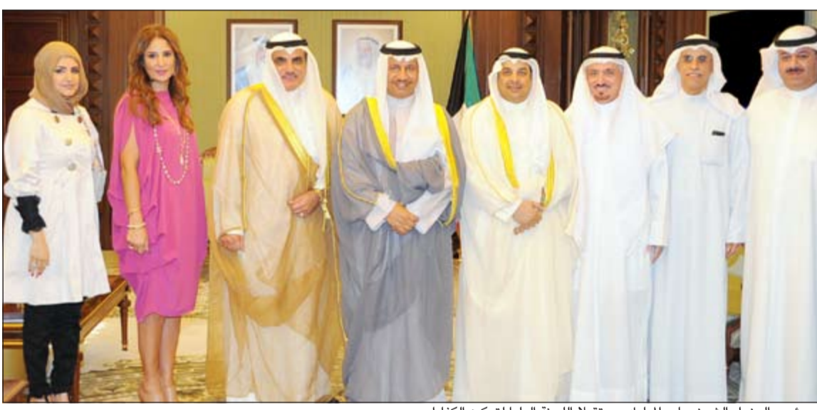
سمو رئيس الوزراء الشيخ جابر المبارك مستقبلا اللجنة العليا لتمكين الكفاءات