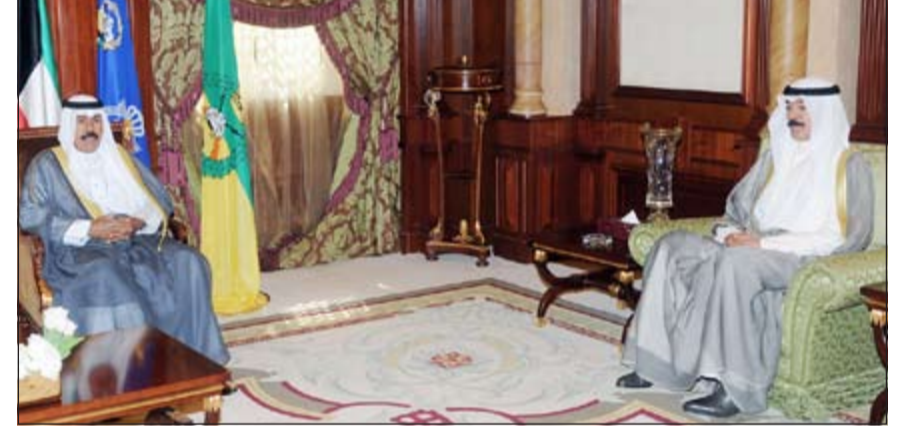
سمو ولي العهد الشيخ نواف الاحمد مستقبلا الشيخ محمد الخالد

كما استقبل سمو ولي العهد الشيخ نواف الاحمد بقصر بيان صباح امس وزير الدولة لشؤون الاسكان ياسر أبو. خالد الجراح. واستقبل سمو ولي العهد بقصر بيان صباح امس وزير الدولة لشؤون مجلس الوزراء الشيخ محمد العبدالله.