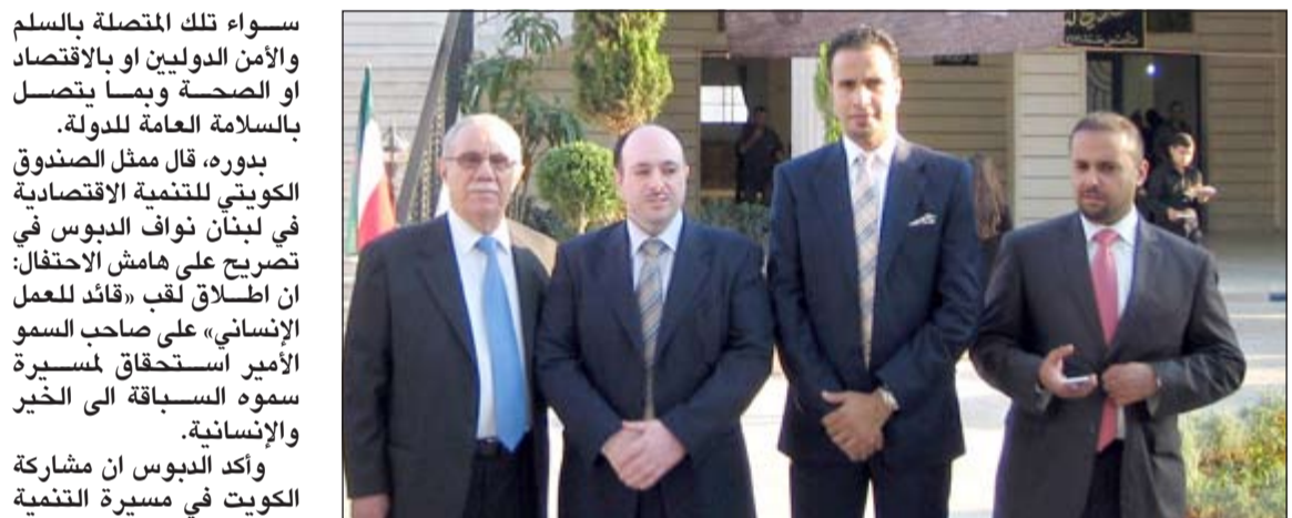
المشاركون في احتفال التكريم في كفر صير