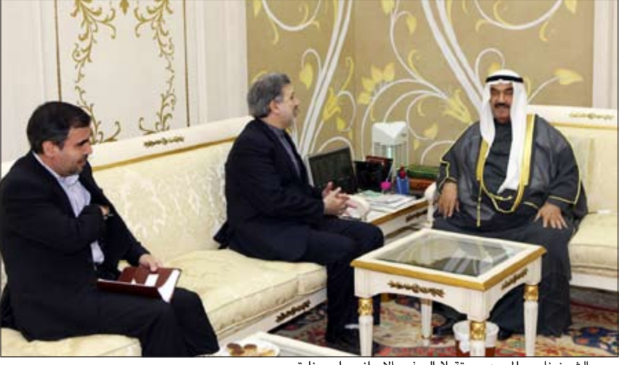
سمو الشيخ ناصر المحمد مستقبلاً السفير الإيراني علي عنابتي

استقبل سمو الشيخ ناصر المحمد في قصر الشويخ امس وزير الشؤون الخارجية بالجمهورية الاثيوبية الفيدرالية الديمقراطية الصديقة د. تيدروس ادهانوم والوفد المرافق له، بمناسبة زيارته للبلاد. كما استقبل سمو الشيخ ناصر المحمد في قصر الشويخ امس سفير الجمهورية الإسلامية الإيرانية الصديقة لدى الكويت علي رضا عنابتي.