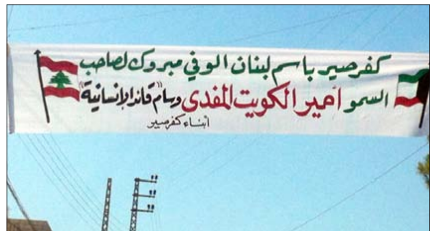
تهنئة لصاحب السمو الأمير

العالم انطلاقاً من لبنان تؤام الكويت. ثانياً: الأساليب الجديدة في معالجة قادرة على مواجهة ما يهدد الإنسانية من كوارث طبيعية ومن فقر وجوع ومرض. ثالثاً: دور سموه والكويت في التصدي لظاهرة التغير المناخي. رابعاً: دور سموه والكويت في التصدي للفساد والفساد ووقوعها على المدنيين اطفالاً ونساءً. خامساً: تقديم الكويت ما قيمته عشرة في المائة من اجمالي المساعدات التي تقدمها للدول المتضررة من الكوارث التي هي من صنع الانسان. اننا في طليعة الجمع الذين يقدرون عالياً مساهمات الكويت في ادارة السلامة والامن الدوليين. اننا لمسنا دور الكويت كما في لبنان كذلك بالنسبة الى الشعب السوري الشقيق. فقد كان رئيس مجلس الأمة مزروق الغانم هو الوحيد الذي