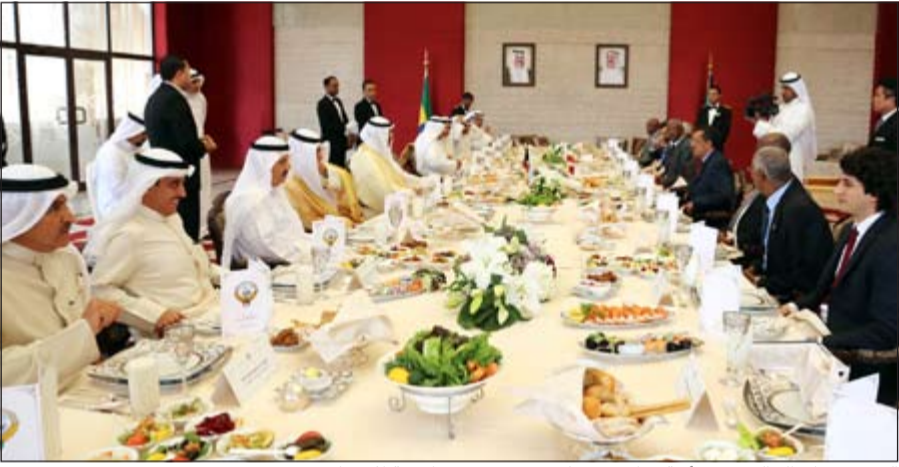
الشيخ صباح الخالد يقيم مائدة غداء عمل على شرف وزير خارجية إثيوبيا