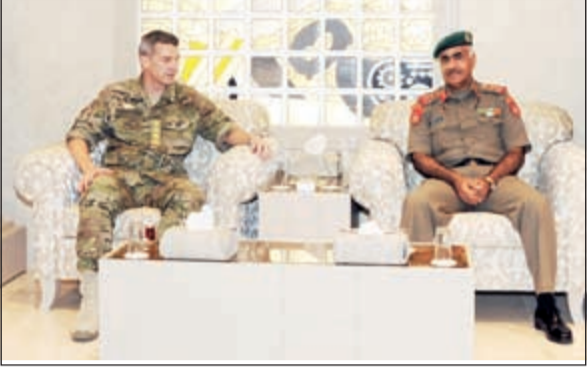
الفريق الركن محمد الخضر خلال استقباله الفريق بيتر بارترام

يوسف عبدالعزيز الشايخ وعدد من قادة الجيش.