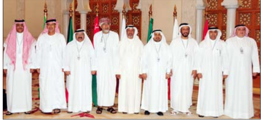
اللواء الركن أحمد العميري والمشاركين في الاجتماع

الاجتماعات، سائلا الله عز وجل للجميع التوفيق والنجاح، والعمل دائما على تعزيز أواصر التعاون والإخاء بين دول المجلس، تحت ظل قيادة أصحاب الجلالة والسمو قادة دول المجلس التعاون لدول الخليج العربية. بعد ذلك ألقى الأمين العام المساعد للشؤون العسكرية في الأمانة العامة لدول مجلس التعاون لدول الخليج العربية اللواء الركن خليفة الكعبي، كلمة شكر من خلالها الكويت على استضافة مثل هذه الاجتماعات، التي تسهم في تعزيز العمل الخليجي المشترك وتهدف إلى تحقيق منظومة عمل موحدة لدول مجلس التعاون لدول الخليج العربية، والجدير بالذكر أن الوفود المشاركة في الاجتماع قد وصلت للبلاد مساء يوم السبت.