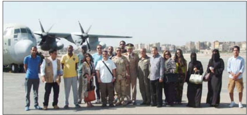
الوفد لدى عودته إلى البلاد

عن جزيل الشكر والتقدير لنائب رئيس مجلس الوزراء ووزير الدفاع على هذه المبادرة الكريمة وحرصه الدؤوب على تقديم جميع التسهيلات والإمكانات لأبنائه من أسر الشهداء العسكريين، تقديرا منه للجهود البطولي ومساهمة وتضحيات جيشنا الباسل في الحروب العربية، كما أبدى أهالي الشهداء كل الشكر والامتنان لمعاليمه الذي سخر كل الجهود والإمكانات لخدمتهم لزيارة قبور ذويهم من الشهداء في حرب 1973.