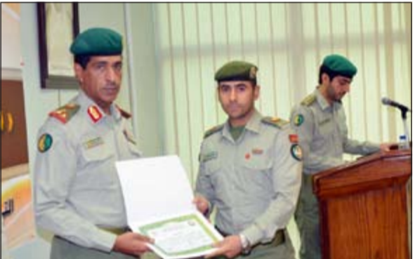
تكريم أحد المشاركين في الدورة

بحضور قائد التنظيم والقوى البشرية العميد الركن فهد عبد ناصر اختتمت مديرية التنظيم والتخطيط الاستراتيجي بالحرس الوطني دورة «مقدمة في التخطيط والأداء الإستراتيجي» التي التحق بها 14 ضابطا من مختلف وحدات الحرس الوطني. وقال مدير مديرية التنظيم والتخطيط الاستراتيجي المقدم الركن ناصر الشطي إن الضباط المتتحقين بالدورة تم تدريبهم على مفهوم الإدارة الاستراتيجية وأهميتها، والقصد من الخطة الاستراتيجية وعناصر الخطة، ومصطلحات التخطيط والخطة الاستراتيجية، والخطط التشغيلية وكيفية متابعتها، وقياس وتقييم الخطة بالإضافة إلى إشراكهم في ورشة عمل لإعداد نماذج المتابعة. وأضاف المقدم الركن ناصر الشطي أن قيادة التنظيم والقوى البشرية تحرس دائما على تذليل كل الصعوبات والمعوقات التي تواجه الخطة الاستراتيجية في الحرس الوطني وتقديم التدريب