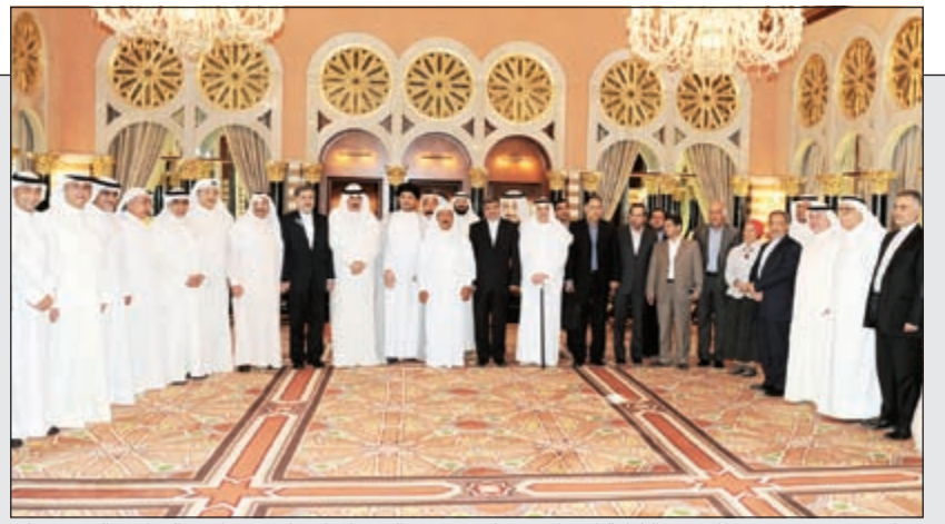
جواد بوخمسين متوسماً وزير الثقافة الإيراني د.علي جنتي والوفد المرافق له وعدد من النواب والشخصيات خلال حفل الغداء الذي أقامه على شرف الضيف في ديوان بوخمسين (هاني الشمري)

جواد بوخمسين أقام حفل غداء على شرف وزير الثقافة الإيراني بمناسبة زيارته للبلاد: جنتي ساهم في تطوير وتعزيز العلاقات بين الكويت وإيران 10