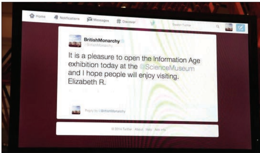
التغريدة الملكية الأولى

وقالت الملكة البريطانية (88 عاماً) في تغريدتها في افتتاح صالة عرض جديدة في متحف العلوم في لندن «من دواعي سروري أن افتتح صالة عرض عصر المعلومات أمس في متحف العلوم وأمل أن