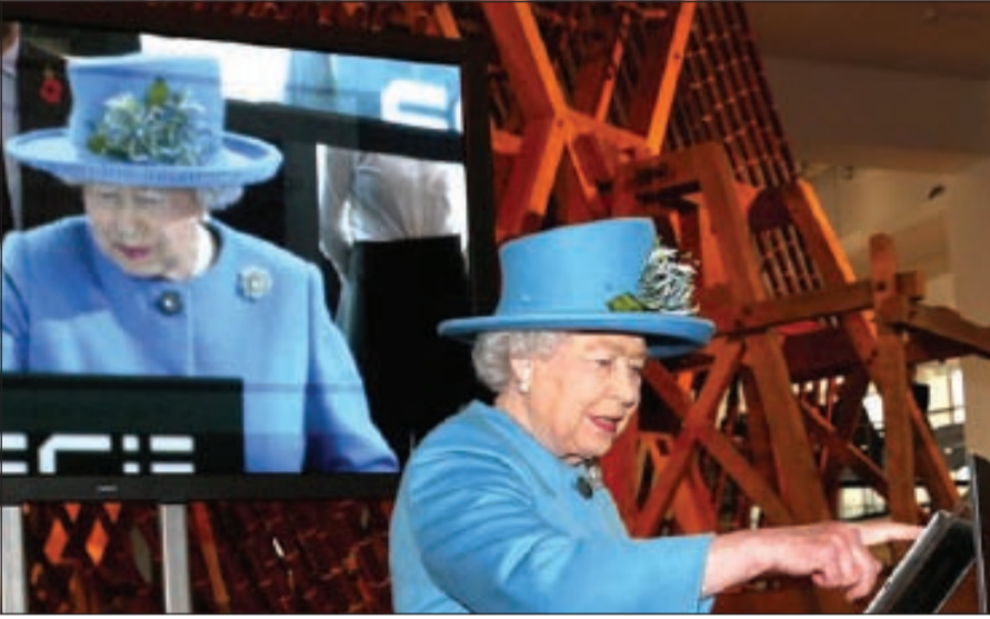
الملكة لحظة إرسالها تغريدتها

يستمع الناس بزيارتها. اليزابيث أر... وأعيد تغريد الرسالة الملكية أكثر من أربعة آلاف مرة في الدقائق الخمس والأربعين التي تلت نشرها.