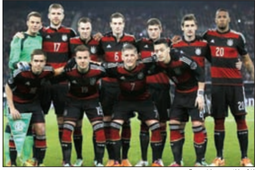
الأبطال في المقدمة

احتفظ المنتخب الألماني، بطل العالم، بموقعه في صدارة الترتيب العام لتصنيف الاتحاد الدولي لكرة القدم لشهر أكتوبر الصادر أمس الخميس. رغم البداية الباهتة للمكينسات الألمانية في تصفيات يورو 2016 ظل الفريق الفائز بلقب مونديال البرازيل في مقدمة التصنيف. وحقق المنتخب الألماني فوزاً وحيداً خلال ثلاث مباريات بتصفيات يورو 2016 ولكنه ظل متقدماً على الأرجنتين وكولومبيا صاحبتى المركزين الثاني والثالث. وتقدم المنتخب البلجيكي من المركز الخامس إلى الرابع كما تقدم المنتخب الفرنسي من المركز التاسع إلى السابع وتقدم المنتخب البرتغالي من المركز الحادي عشر إلى التاسع. وحل المنتخب الهولندي في المركز الخامس متأخراً بمركز واحد يليه المنتخب البرازيلي في المركز السادس فيما جاء منتخب الأوروغواي في المركز الثامن متأخراً بمركز واحد والمنتخب الإسباني في المركز العاشر متأخراً مركزين.