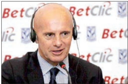
أريغو ينفذ البيانكونيري

أشار أريغو ساكي، المدرب السابق لنادي ميلان ومنتخب إيطاليا، إلى أن الطراز الإيطالي لكرة القدم يختلف بشكل كامل عن باقي أندية أوروبا، عقب خسارة نادي يوفنتوس أمام أوليمبيكوس بهدف نظيف، ضمن منافسات بطولة دوري أبطال أوروبا.