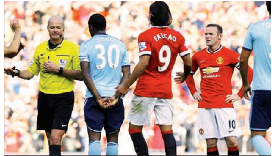
وست هام وموسم جيد إلى الآن

● انتر ميلان : «الأفاعي» لم تعد سامة بعد الآن، أين هم؟ في المركز التاسع، النير اتزوري سببى للغاية، يبدو أن ماتزاري لم يطرب الأفاعي بعد حتى تتمايل على موسيقاه وعليه أن يجد حلا وبسرعة. وفي النهاية، السباق لازال طويلا للغاية وبحاجة لأصحاب النفس الطويل، فهل يستطيع من هم في المقدمة الحفاظ على تقدمهم؟ وهل من بالخلف يمكنهم التقدم؟ هذا ما سنعرفه بعد أن ندخل في الأيام الحاسمة في الموسم.