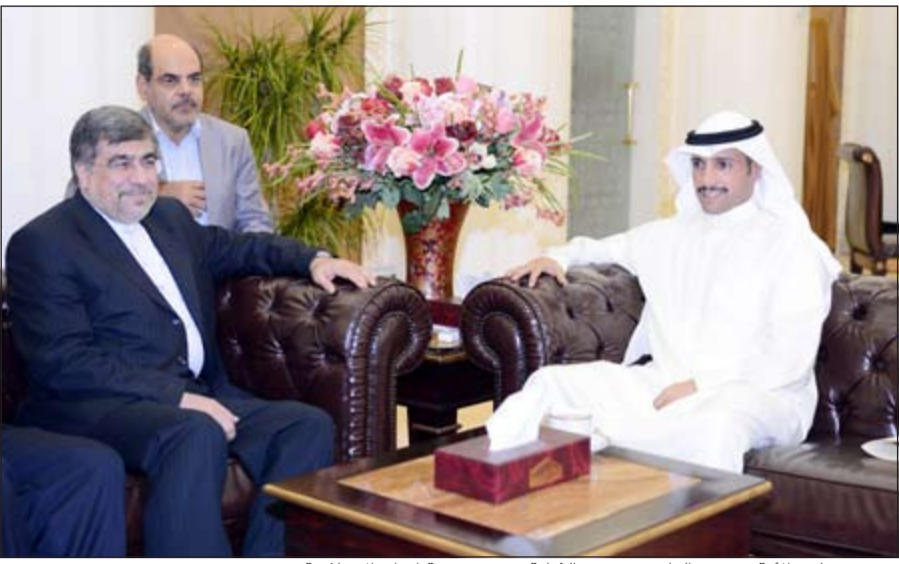
رئيس مجلس الأمة مرزوق الغانم مع وزير الثقافة في جمهورية إيران الإسلامية

هؤلاء المواطنين ومعالجة القضية بصورة تضمن حقوق كل من يرغب في العمل في القطاع الخاص، ومخاطبة جميع الجهات المسؤولة من اجل رفع الحرج عن اخواننا الذين وجدوا انفسهم بلا عمل من دون اي ذنب، وبلا دخل مادي لتغطية التزاماتهم اليومية ونص الاقتراح على: ان يكون لموضوع الموظفين الكويتيين الذين تم انتهاء خدماتهم في القطاع الخاص الاولوية وبصفة عاجلة لدى السلطة التنفيذية، لما لهذا الموضوع من أثر اجتماعي واقتصادي كبير وانتهيار وتفكك الاسر في المجتمع الكويتي، واعطاء الموظفين الكويتيين الذين تم انتهاء خدماتهم في القطاع الخاص صفة الاولوية بالتوظيف سواء من خلال برنامج إعادة هيكلة القوى العاملة والجهز التنفيذي للدولة او ديوان الخدمة المدنية، واستمرار صرف بدل المسرّحين لحين تمكنهم من الحصول على وظيفة وفتح الباب للمسرّحين الجدد للاستفادة من البديل، واستمرار وإضافة جميع العلاوات الاجتماعية للمسرّح، وايقاف جميع