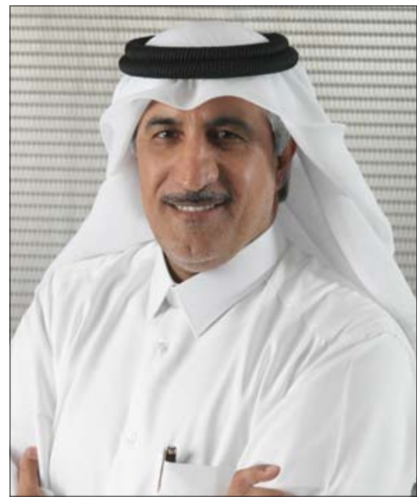
الشيخ عبدالله بن محمد بن سعود آل ثاني

والمنتجات وخدمة العملاء كما أننا لم نتوقف يوماً عن سعينا الدائم إلى استعادة الحصة السوقية. واصلت Ooredoo الجوائز تحقيق النجاحات طوال هذه الفترة نظراً لارتفاع علائقنا إلى خدمات الجيل الثالث. وقد شهدت هذه الفترة تطوراً جيداً ونواصل التركيز على التنفيذ المتواصل والمتميز لاستراتيجية النمو الطويل الأمد الخاصة بنا..