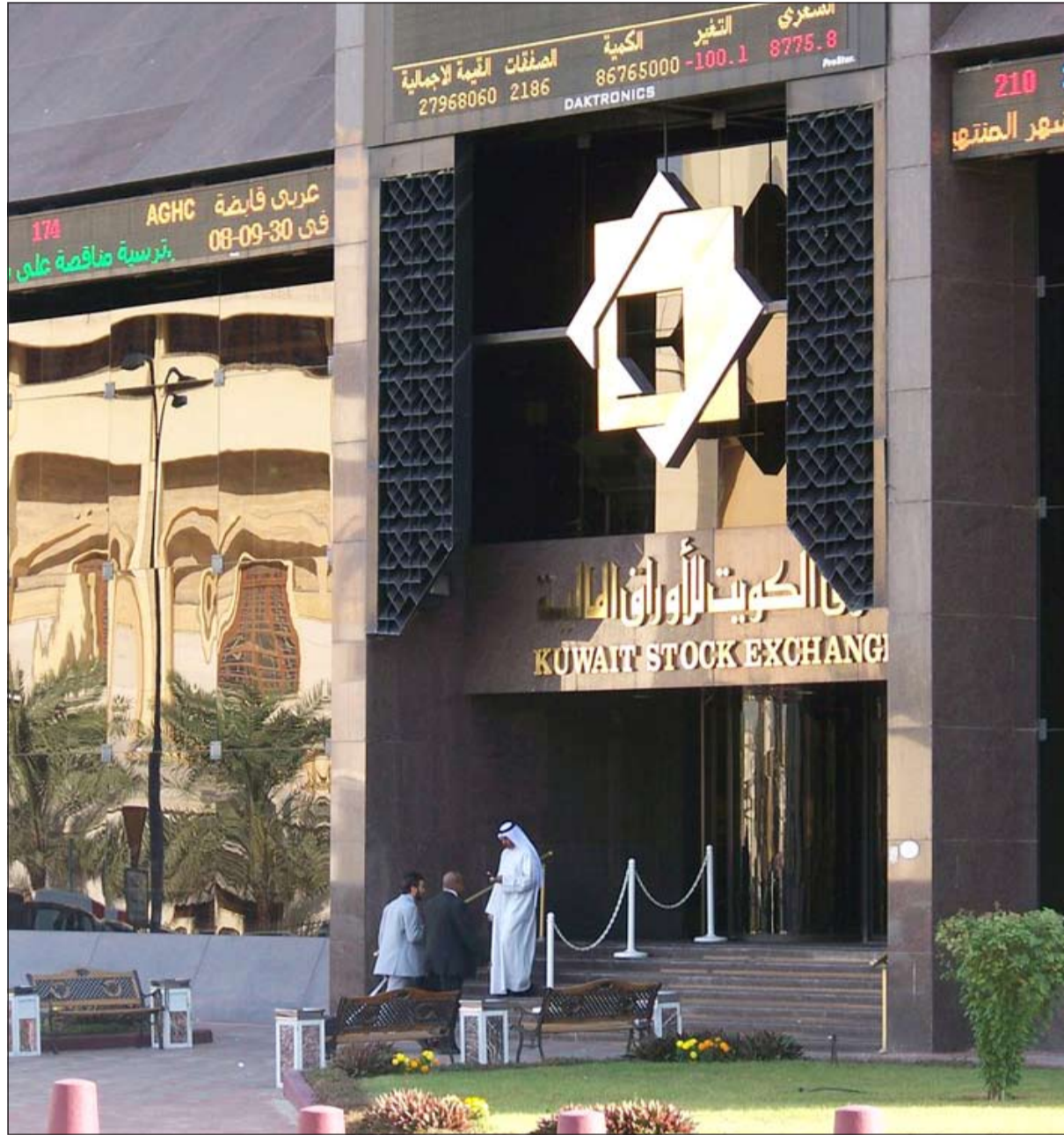
البورصة تتحضر لمرحلة جديدة من الاكتتابات العامة مع موافقة الهيئة العامة للاستثمار أمس على بيع مساهماتها في الشركات المدرجة على أن تبدأها مع «الكويتية للاستثمار».

البورصة من ناحية القيمة والحجم، لكن مصادر أخرى قالت لـ «الانباء» أنه من المرجح أن يتم الاتفاق قريباً على السعر وإعلان ذلك قبل نهاية السنة، حتى يكون السهم محملاً بأرباح 2014، وبالتالي يمكن للمواطن الحصول على قيمة إضافية من خلال التوزيعات النقدية للسهم عن هذه السنة، كما يمكن هذا السيناريو من عدم بيع المواطنين أسهمهم بكثافة بعد الاكتتاب. من ناحية أخرى، أنهت المؤشرات الرئيسية لسوق الكويت لسلاوراق المالية جلسة أمس على تباين في الأداء، وذلك بسبب الضغوطات التي تعرضت لها بعض الأسهم القيادية مثل «بيتك» و«زين» في مستهل الجلسة بعد أخبار توجه الهيئة لبيع حصصها في بعض البنوك والشركات المدرجة بالبورصة، تلك الأخبار ساهمت في تراجع تلك الأسهم ومن ثم تراجع السوق استجابة لهذه الضغوطات. وتراجع سهم «بيتك» 2,5% بعد هبوطه إلى مستوى 780 فلساً خاسراً 20 فلساً دفعته ليلوغ أدنى مستوياته منذ ثلاثة أشهر ونصف الشهر تقريباً، واحتل سهم «بيتك» المرتبة الأولى من حيث قيم التداولات، حيث بلغت قيمة تداولاته نهاية الجلسة 5,8 ملايين ديناراً تقريبا جاءت من خلال تنفيذ 335 صفقة على نحو 7,5 ملايين سهم.