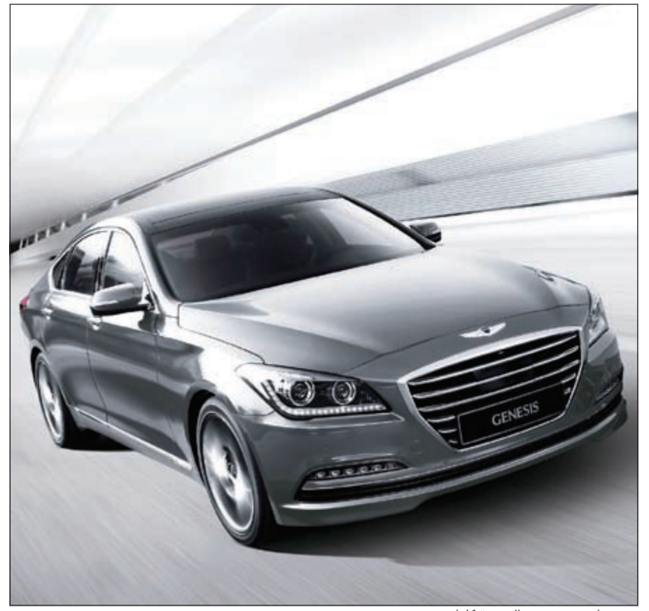
«هيونداي جنيسيس» الجديدة كلياً

وتتابع الشركة استثمارها في تعزيز مكانة العلامة التجارية عبر باقة من الفعاليات والمبادرات ومن ضمنها الانخراط الفعال في الأنشطة التسويقية الرياضية البارزة مثل تلك التابعة للاتحاد الأوروبي لكرة القدم والاتحاد الدولي لكرة القدم (فيفا) وبطولة العالم للرياضات وغيرها العديد. وفي كوريا، قامت الشركة العملاقة لتصنيع السيارات بافتتاح أول منشأة للتجربة الخاصة بالعلامة التجارية تحت اسم