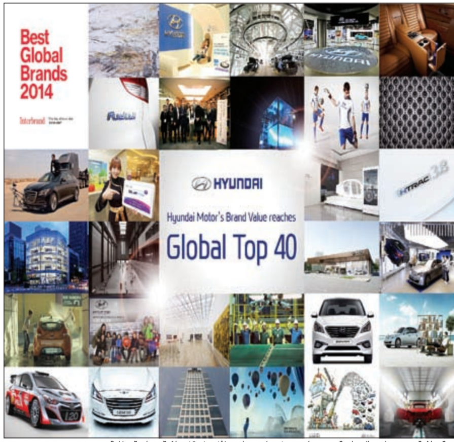
قيمة علامة «هيونداي» التجارية تنضم لتصنيف «إنتربراند» لأفضل 40 علامة تجارية عالمية

أعلن بنك الخليج عن تقديم عرض خصومات حصرية مميزة لحاملي بطاقات الائتمانية وبطاقات الخصم على المأكولات لدى مطاعم «Blends» التي يحصل عليها عند استخدام بطاقات بنك الخليج الائتمانية أو بطاقات red للسحب الآلي على خصومات مميزة تصل إلى 20٪ لدى كل من مطعم ذي سبايس كلوب، وكاسبر أند جامبينيز، وواترليومون كافيه، وليفينج كولورز، وزهر الليمون وفلافل ناديا، ويسري هذا العرض لغاية 31 ديسمبر 2014. هذا ويلتزم بنك الخليج بمنح عملائه تشكيلة حصرية من العروض التي يحرص على تجديدها وتنويعها بصورة مستمرة، إلى جانب مجموعة متميزة من الخدمات المصرفية والمنتجات المالية، حيث يستمكن عملاء بنك الخليج حاملو البطاقات الائتمانية أو بطاقات red للسحب الآلي من سداد قيمة وجباتهم والاستفادة من هذا العرض الحصري.