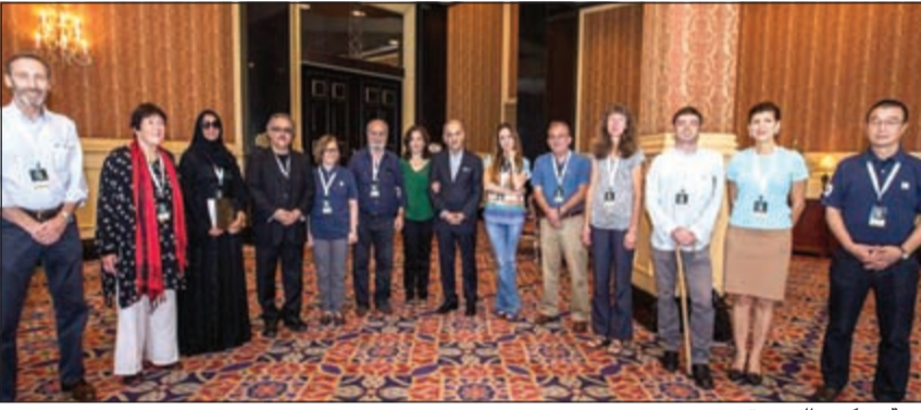
لجنة تحكيم الجزيرة