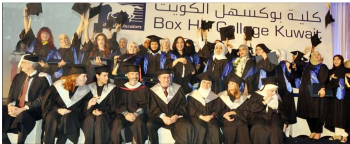
صورة جماعية للطالبات الخريجات خلال الحفل (أحمد علي)