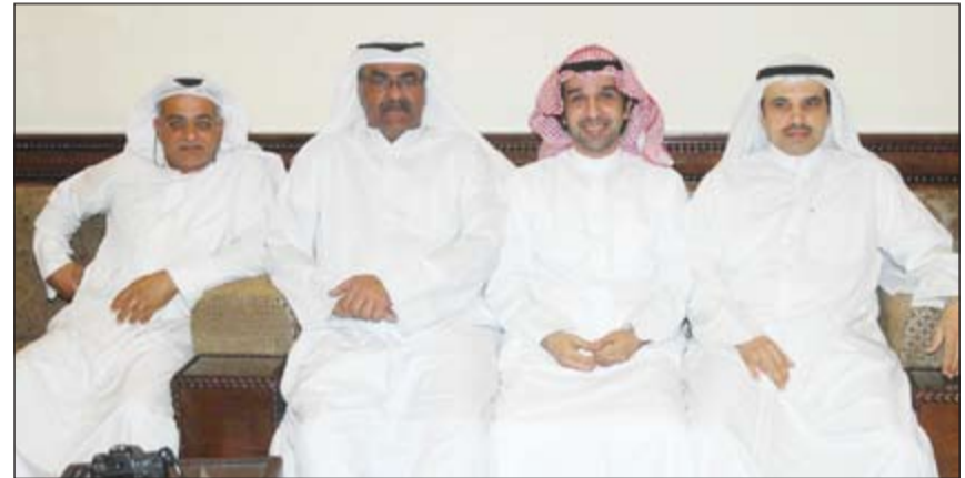
إداريو «التطبيقي» خلال اجتماعهم لإعلان عن تنظيم الإضراب اليوم (هاني عبدالله)

مع طرف ضد طرف، ومنح صلاحيات للموظفين في ممارسة عملهم بشكل شامل وأساسي وليس تجميدهم وإجبارهم على اللجوء إلى المحاكم، وتابع أن الخدمة المدنية أصدرت أكثر من قرار للإداريين وليست للأكاديميين ومع الأسف نجد الإدارة العليا تمنح المناصب للأكاديميين. وقال إن الخطوة الأولى ستكون الإضراب الجزئي وإيصال رسالة للإدارة العليا وفي حال لم تتمثل إلى المطالب والإداريين وتحققها فالضغينة سيتواصل من خلال تنظيم ندوات وإضرابات أخرى، مضيفاً أننا نسعى خلال الأسابيع المقبلة إلى إישاء رابطة للدفاع عن حقوق الإداريين وسنعمل على إظهارها.