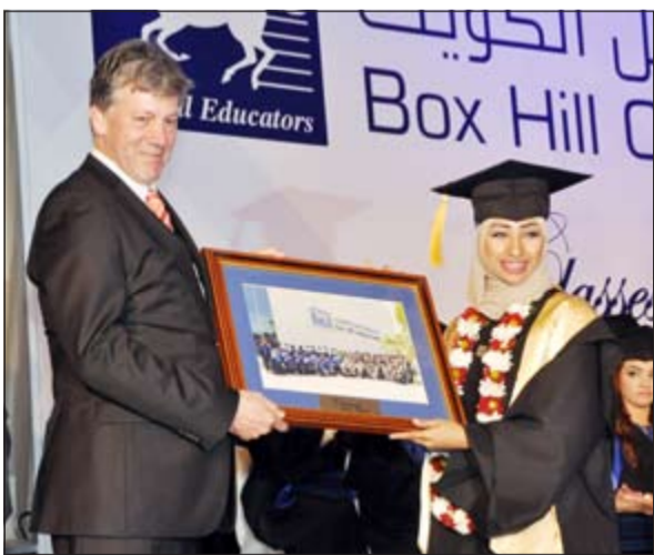
تكريم إحدى الخريجات