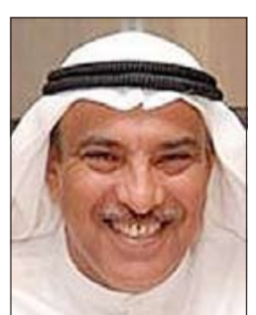
د. خالد الصالح

معرين عن تقديرهم لمساهماته الكبيرة في مجال علاج الأورام ولاسيما علاج الأورام بالإشعاع. وفي هذا السياق، أكد المدير الإقليمي لمنظمة الصحة العالمية لإقليم شرق المتوسط، د.علاء الدين العلوان أنه وستناد إلى توصية لجنة المؤسسة كانت اللجنة الإقليمية في دورتها الـ 60 قد أقرت منح الجائزة عن عام 2013 إلى د.خالد الصالح من الكويت على أن تقدم له في الدورة الحالية. واستعرض الصالح فقرات مدعمة بالأرقام ومختصرة وعميقة في الوقت ذاته عن قصة الإنسان ومرض السرطان، مذكرا بأنه وحين قبل الإنسان التحدي بدأت بوادر النجاح لنجاح معدل الشفاء العام للسرطان من 49% بين عامي 1971 و 1977 إلى 68% بين عامي 2003 و 2009.