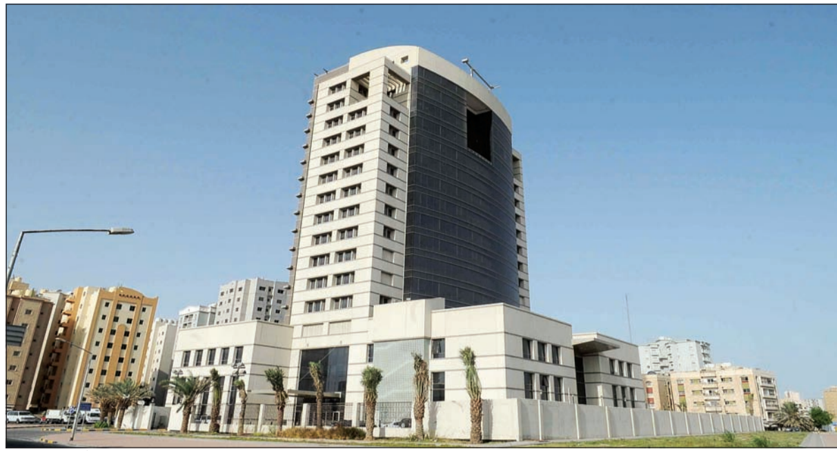
(إسماعيل أبو عطية)