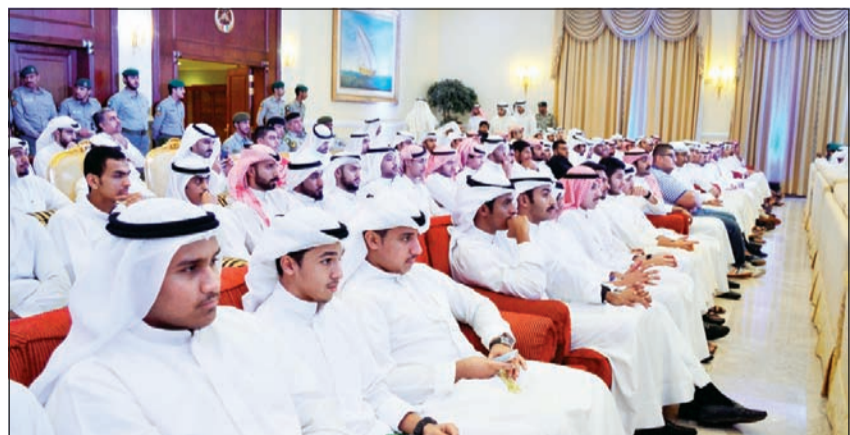
صورة جماعية لخريجي الدورة

برعاية وكيل الحرس الوطني الفريق ناصر الدعي وحضور قائد وحدات الأركان اللواء ركن م. هاشم الرفاعي وكبار قادة الحرس الوطني اختتم الحرس الوطني مبادرة «تنمية ووفاء لكويت العطاء» الثالثة التي انخرط في دوراتها التدريبية 100 من الشباب الكويتي تم تخريجهم في احتفالية أقيمت في نادي ضباط الحرس الوطني.