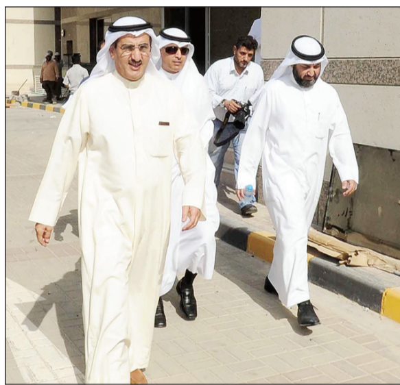
.. وفي جانب آخر من المشروع