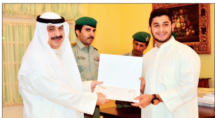
اللواء ركن م. هاشم الرفاعي يكرم أحد الخريجين