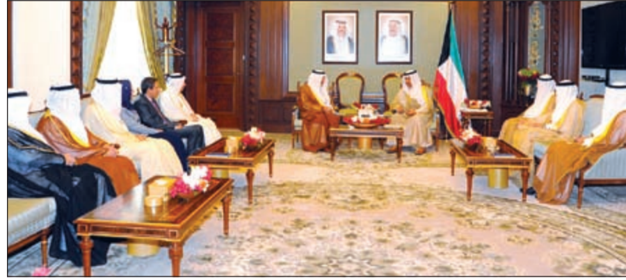
سمو رئيس مجلس الوزراء الشيخ جابر المبارك خلال استقباله وزراء التربية والتعليم لدول مجلس التعاون