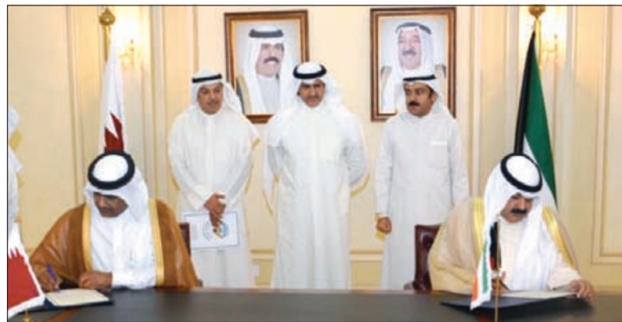
خالد الجارالله خلال توقيع بروتوكول مع سفير قطر حمد بن علي آل حنزاب

اجتمع وكيل وزارة الخارجية خالد الجارالله امس مع سفير روسيا الاتحادية اليكسي سولوماتين وتم خلال اللقاء بحث عدد من أوجه العلاقات الثنائية بين البلدين إضافة إلى تطورات الأوضاع على الساحتين الإقليمية والدولية. كما احتفل امس في وزارة الخارجية بالتوقيع على بروتوكول خاص بتعديل الاتفاقية المبرمة بين حكومة الكويت وحكومة قطر الشقيقة بشأن تقديم تسهيلات لإقامة البعثات الدبلوماسية. ووقع عن الجانب الكويتي