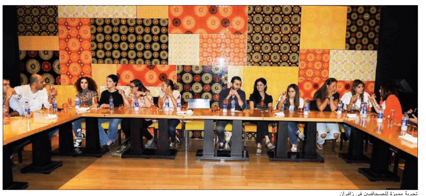
تجربة مميزة للمساهمين في زافران