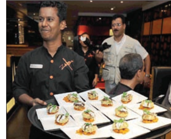
أطباق فريدة بنكهات هندية مميزة (إسامة ابرعيطية)

والو تيكا (كعك البطاطا المحمر في المغلاة على طبق من الماسالا. كما تضم القائمة الجديدة تشكيلة من أطباق الكباب ووجبات خاصة للنباتيين وغير النباتيين والمأكولات البحرية مع أطباق خاصة للعائلات، وتشمل الأطباق الرئيسية خيارات أوسع من البرياني، تشمل برياني عوضى بجاج وبرياني الروبيان الكبير، اما منتجات التدوير فتضم (تيكا) سالون هارياي) وبهاتي كا مورغ وتيكا بودينا بانيسر، الروبيان الملكي بالتندوري، كما يمكن لعشاق الكاري تذوق طبق الدجاج بالكاري من زافران زساع ولال ماس كما يقدم زافران قائمة مشروبات جديدة تكمل قائمة الطعام وتوفر خيارات متنوعة للضيوف تتنوع بين مشروب لاسي وعصائر