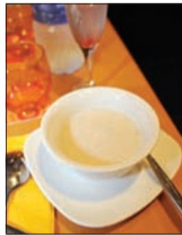
حساء المشروم المميز