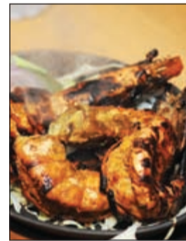
طبق الروبيان الفاخر