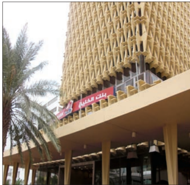
المبنى الرئيسي لبنك الخليج

الرئيس التنفيذي: النمو في الأرباح استمر رغم البيئة التنافسية