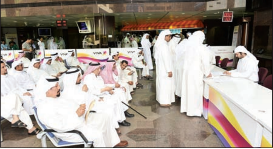
كاونتر منظم لعملية دمج أسهم VIVA في البورصة أمس

الأم، فيما لا يعتمد حكم الحضانة نهائياً. وحول الطلبات العامة لتفويض الأشخاص ذكرت إدارة السوق أنه في حال حضور صاحب العلاقة يتطلب التفويض أصل البطاقة المدنية للمفوض له وصوره عنهما، ورقم تداول صاحب العلاقة، واختيار اسم شركة الوساطة، أما في حالة وجود وكالة عامة عن صاحب العلاقة، فيطلب التفويض الوكالة العامة الأصلية وصوره عنها، وأصل البطاقة المدنية للطرفين وصوره عنها، بالإضافة إلى رقم تداول صاحب العلاقة واختيار اسم شركة الوساطة، أما عن التصديق من البنك، فيطلب التفويض أصل البطاقة المدنية للطرفين وصوره عنها، ورقم تداول صاحب العلاقة، واختيار اسم شركة الوساطة، وأخذ نموذج التفويض مطبوعاً من إدارة الوسطاء وتوقيعه من صاحب العلاقة وتصديق التوقيع من البنك وإحضاره إلى الوسطاء مرة أخرى لاعتماده خلال 10 أيام عمل من تاريخه.