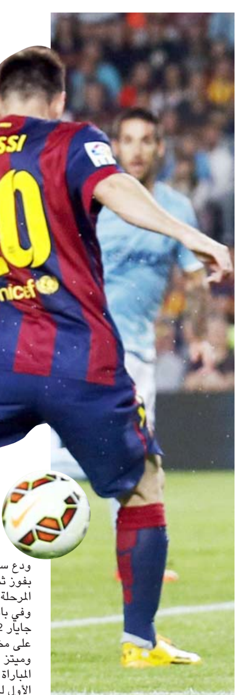
تعزيز يتحضر جراء التعادل

واصل برشلونة ريادة الدوري الإسباني لكرة القدم بفوزه على ضيفه إيبار الوافد الجديد 3-0 على ملعب «كامب نو» في افتتاح المرحلة الثامنة. وعانى «البارسا» الأمرين لتحقيق الفوز خاصة في الشوط الاول وانتظر حتى الدقيقة 60 لفك التكتل الدفاعي لضيقه وافتتاح التسجيل عبر قائده المخضرم تشافي هرنانديز بعد تلقيه كرة على طبق من ذهب من نجم الدولي الأرجنتيني ليونيل ميسي داخل المنطقة وخلف الدفاع فتابعتها من مسافة قريبة داخل المرمرى، وعزز الدولي البرازيلي نيمار تقدم الفريق «الكاتالوني» بالهدف الثاني من تسديدة على الطائر من نقطة الجزاء اثر تمريرة عرضية من مواطنه دانيال الفيش (71). وصنع نيمار الهدف الثالث الذي حمل توقيع ميسي عندما هيا له كرة عند حافة المنطقة فتوغل داخلها وسدها قوية بيسراه ارتطمت بالقائم الأيسر وعانقت الشباك (73)، وهو الهدف الـ 250 لميسي في «الليغا» ويات على بعد هدف واحد فقط من معادلة الرقم القياسي لأفضل هداف في تاريخ المسابقة مهاجم اتلتيك بلباو تيلمو زارا (251). وحافظ «البلوغرانا» على فارق النقاط الأربع التي تفصله عن غريمه التقليدي ريال مدريد قبل مواجهتهما السبت المقبل على ملعب سانتياغو برنابيو في الكلاسيكو، كما أن برشلونة استعد جيدا لمواجهة أياكس امستردام الهولندي الثلاثاء المقبل في الجولة الثالثة لمسابقة دوري أبطال أوروبا حيث يسعى إلى تعويض خسارته أمام باريس سنان جرمان الفرنسي 3-2 في الجولة الثانية. وتعادل اتلتيك بلباو مع سلتا فيغو بهدف لاريتش أدوريتش (6) من ركلة جزاء) مقابل هدف مانويل نوليتو (73).