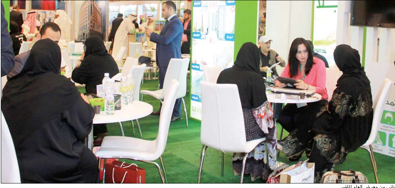
جانب من معرض العام الماضي