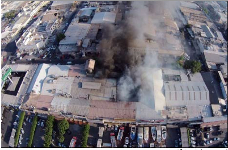
تصوير من علو لحريق الشويخ