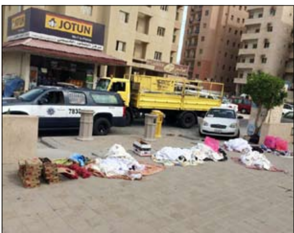
حصيلة الحملة ملابس وخضراوات