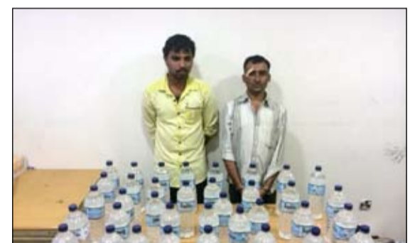
الأسويان والخمور المضبوطة في الجهراء