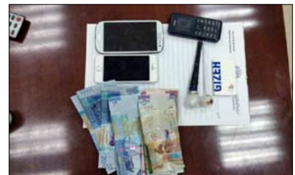
المضبوطات احيلت الى «المكافحة»

ان دورية تابعة لأمن حولي اشتبه رجالها بمركبة في منطقة السالمية وعند الطلب من قائدها التوقف لتحرير مخالفة لعدم التزامه بالخطوط الأرضية تمت مشاهدة علبة بلاستيكية على التابلوه محشوه بالحبوب وتم التحفظ عليها ليتضح ان الشخصين اللذين كانا بداخل المركبة بحالة غير