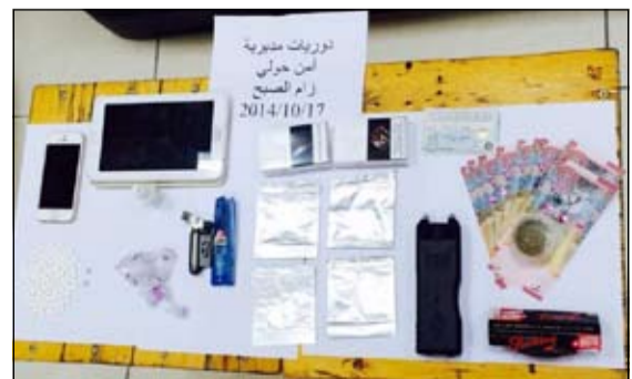
المخدرات المضبوطة من أمن حولي