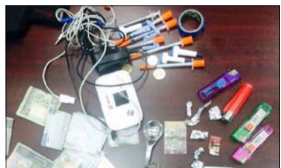
المخدرات وأدوات التعاطي التي ضبطت في الجهراء