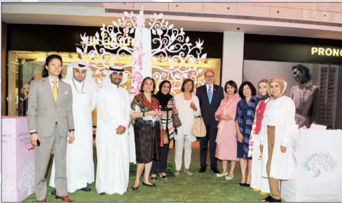
السفير الأمريكي مع أعضاء حملة «حياة» لسرطان الثدي (قاسم باشا)