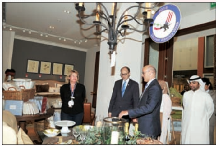
جولة داخل williams sonoma

American Eagle, Foot Locker, Victoria's Secret and Express, through to food brands such as Starbucks and The Cheesecake Factory - we are therefore very pleased to support the annual Discover America week. The initiative is a great way for people in Kuwait to find out more about the best America has to offer