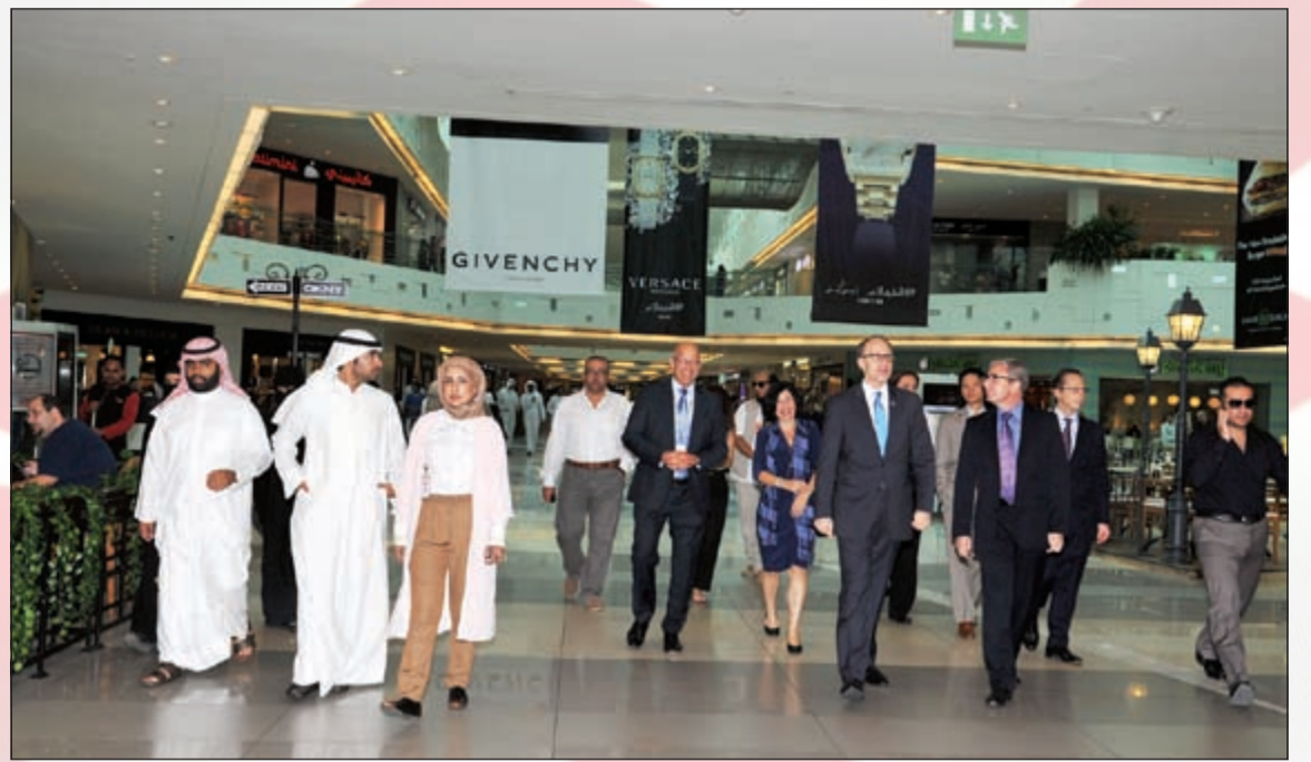
السفير الأمريكي دوغلاس سيليمان وجرمه وكولين اوكين وروبيرت هول وستيفن جورمان وشعاع القاوي خلال الجولة

دعا الشركات الخاصة إلى الاضطلاع بدورها المجتمعي والمشاركة في المشاريع الخيرية