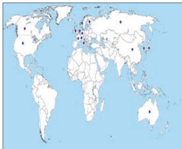
15 بلداً على مستوى العالم تمتلك 95٪ من اختراعات العالم