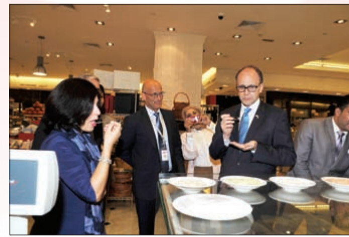
تجربة بعض الأطلعة

تضاعف براءات الاختراع الأميركية في الكويت خلال 2013