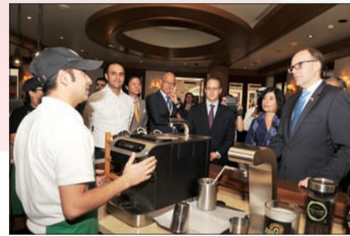
السفير الأمريكي وجرمه داخل مقهى ستاربكس