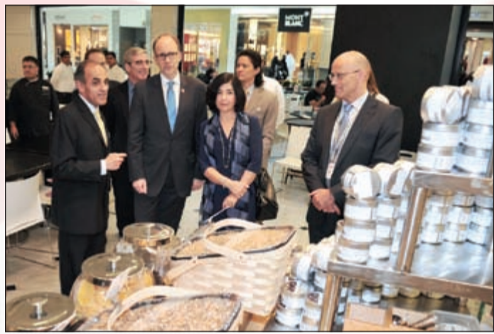
السفير خلال الجولة داخل دين اند ديوكا

نظمت إدارة الأقنيوز بالتعاون مع حملة حياة لسرطان الثدي مبادرة «شجرة الأمل»، وذلك مساهمة من الأقنيوز في دعم الحملة العالمية التوعوية لمكافحة سرطان الثدي، والتي انطلقت منذ مطلع أكتوبر الجاري وتستمر حتى نهاية الشهر، حيث تهدف المبادرة إلى دعوة الزوار للمساهمة بقيمة دينار واحد فقط لتعليق شريط وردي على «شجرة الأمل» الكائنة في الأقنيوز، وذلك تضامنا مع الحملة العالمية التوعوية لمكافحة سرطان الثدي. وتأتي هذه الفعالية ضمن عدد من الحملات التوعوية التي يدعمها الأقنيوز بصورة سنوية بهدف رفع مستوى الوعي حول العديد من القضايا الصحية والاجتماعية بالتعاون مع العديد من الجهات والمؤسسات ذات الصلة.