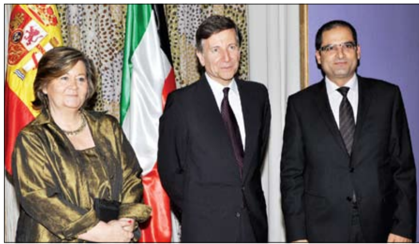
السفير التونسي مهتما السفير الإسباني

الآن وهذا مؤشر واضح على تطور العلاقة بين الطرفين والكل يعرف أن بريطانيا ترتبط ارتباطا تاريخيا بهذه المنطقة ونحن نشعر بهذا الارتباط الذي ينعكس أيضا على مستوى الشعوب. وردا على سؤال حول ما تقوم به دول التحالف حاليا، قال إن المنظمات المتطرفة تستهدف الكويت والمنطقة تصافر الجهود والكويت جزء من هذه الجهود لمواجهة هذه المنظمات. من جانبه قال السفير الإسباني كارلوس سائيتش دي تينسادا إن إسبانيا إلى جانب احتفالها بالعيد الوطني تحتفل هذا العام بمرور 50 عاما على العلاقات الدبلوماسية مع الكويت وقال نحن عازمون على مواصلة تعزيز هذه العلاقات في العديد من المجالات والاستفادة من العلاقات الأخوية بين البلدين، معربا عن ثقته بأن السنوات الخمسين المقبلة ستكون مثمرة أكثر للبلدين.