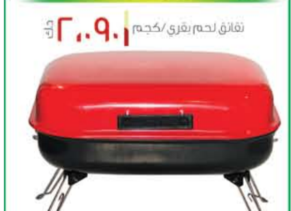
شواية باربيكيو ريلاكس KD. 7.000