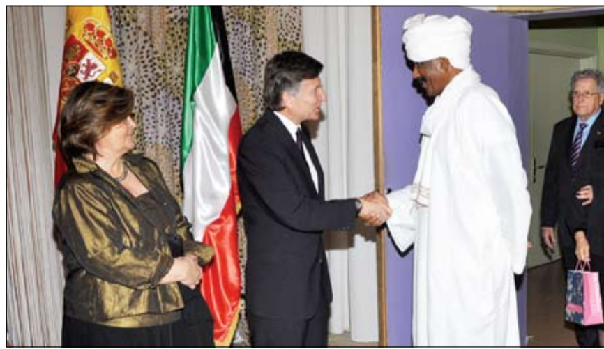
السفير السوداني يقدم التهاني