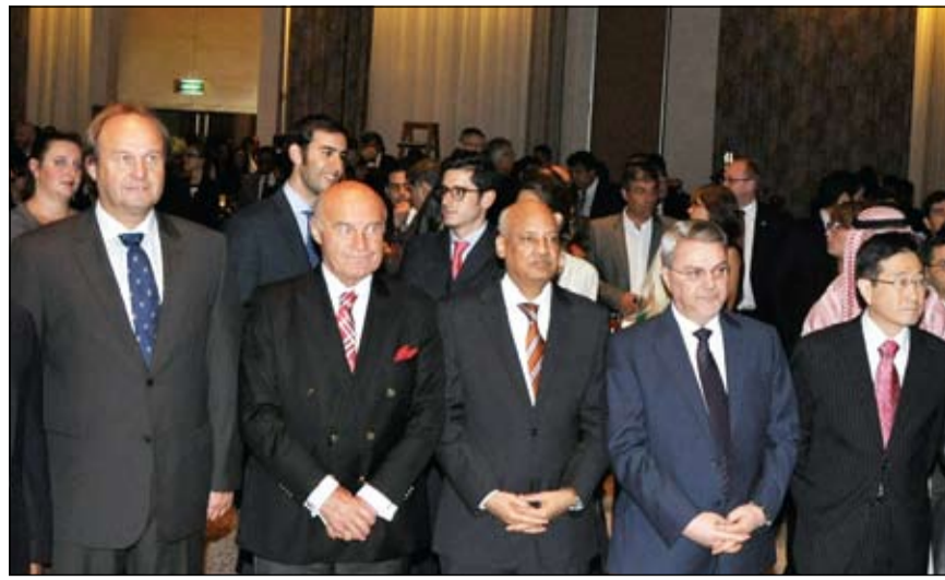
سفيرا مصر والعراق وعدد من الدبلوماسيين والحضور خلال الحفل (أحمد علي)