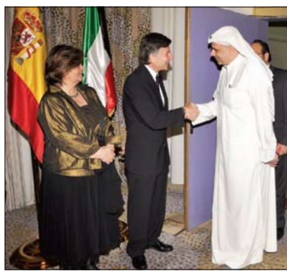
تهان وتبريكات بالعيد الوطني الإسباني

وتابع: ان العلاقات بين دول الخليج وبريطانيا متطورة وقد ارتفع حجم التبادل التجاري بينهما من 9 مليارات دولار سنة 2009 إلى 28 مليار دولار حتى