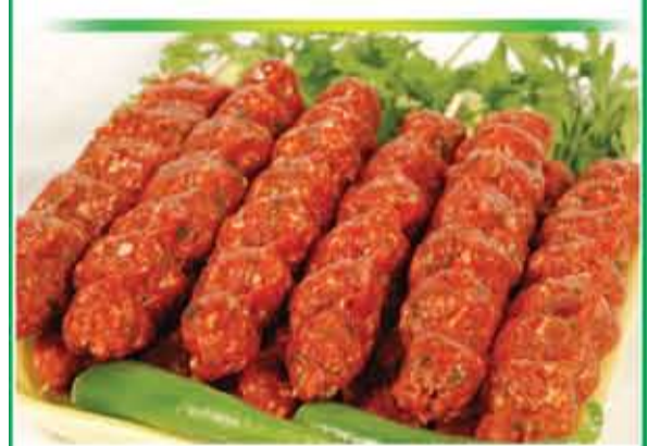
كباب لحم بقري نيوزيلاندي/كجم 2.99.0