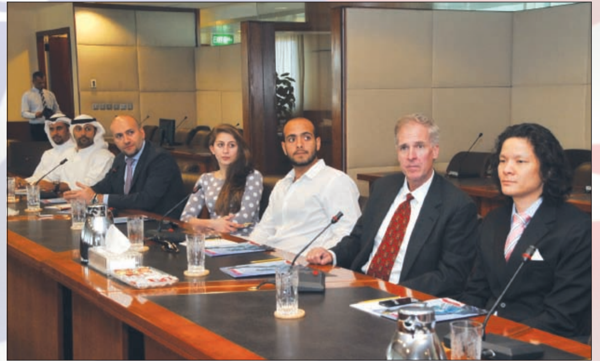
المسؤول التجاري الأول في السفارة دالي مع الحضور في اللقاء

قدم محاضرة بغرفة التجارة والصناعة بعنوان «السحابة الجديدة وعالم الموبايل الأول»