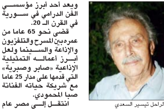
الراحل تيسير السعدي

ويعد أحد أبرز مؤسسي الفن الدرامي في سورية في القرن الـ 20. قضى نحو 65 عاماً من عمره بين المسرح والتلفزيون والإذاعة والسينما ولعل أبرز أعماله التمثيلية الإذاعية «صابر وصبرية» التي قدمها على مدار 25 عاماً مع شريكة حياته الفنانة صبا المحمودي. أنتقل إلى مصر عام