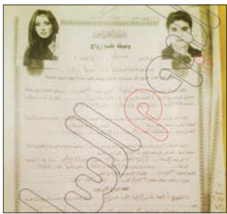
صورة عقد زواج أحمد عز وأنغام