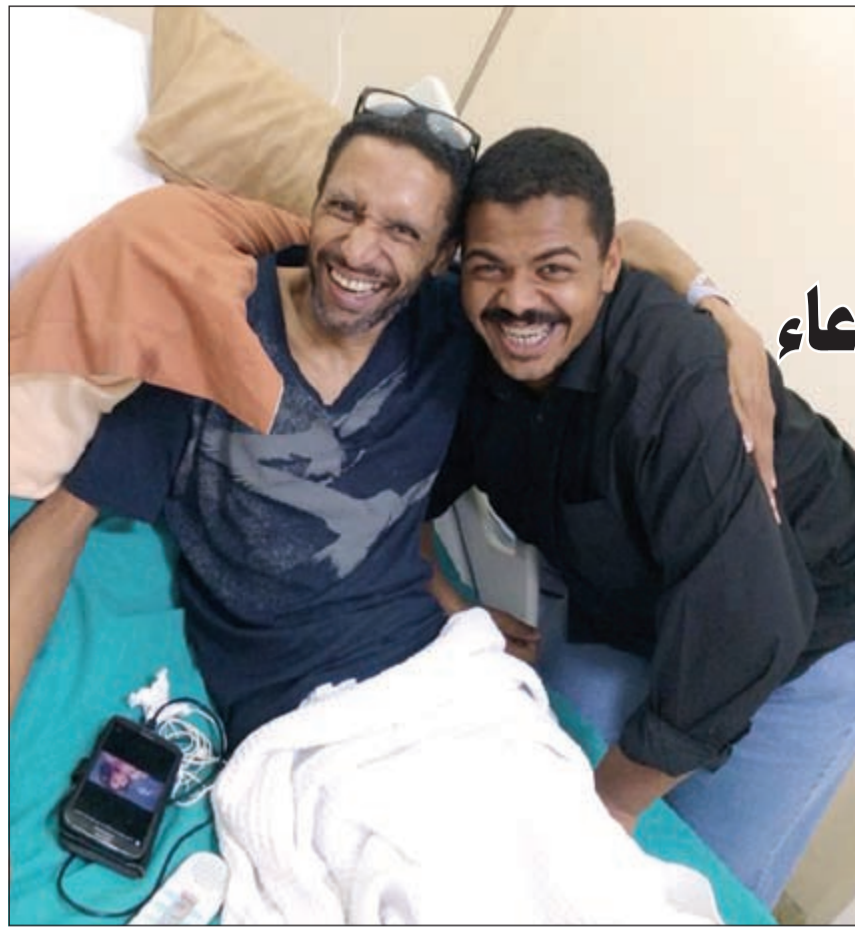
الحمل أثناء زيارته لمطر