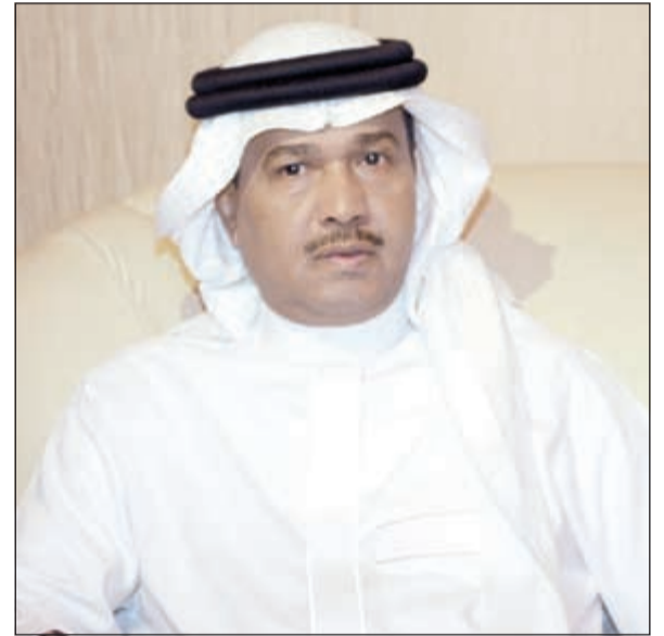
فنان العرب محمد عبده

انتشرت مساء الأحد الماضي رسائل «واتساب» بشكل واسع حول وفاة الفنان العرب محمد عبده إثر نوبة قلبية داهمته بجدة. وفي هذا الصدد أكد ابنه بدر، حسب موقع «سيدتي نت»، أن والده بخير، وأنه يغلق هاتفه الجوال هذه الفترة بسبب سفره إلى لندن، التي وصلها فجر الإثنين. يذكر أن هذه ليست المرة الأولى التي يتم تداول مثل هذه الرسالة المفجعة في عام 2014، بل هي الثالثة، حيث كانت الأولى بداية العام، والثانية مايو الماضي، والغريب أن جميع الشائعات وانتشار مثل هذه الرسالة يتم أثناء سفر محمد عبده.